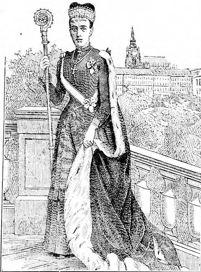
Mária Annunciató főhercegnő a prágai Hradschinban levő nemes-alapítványi intézet apátnője.

És ezt a lealázó sorsot még szerencsénknek kell tartanunk. Örülnünk kell azon, hogy a művelt külföld a mi honi viszonyainkkal ismeretlen, mert ha teljes tájékozottsággal bírna azok felől, — el kellene sülyednünk szégye-