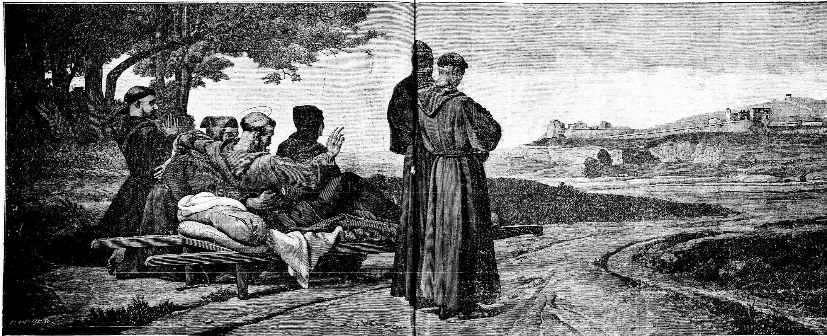
Assiszi szent Ferenc rendalapító halála.

Azok, akik a bankett jegyeket eladásra csoportban elvittek e hó 30-án délig okvetlen leszámolják, mert a