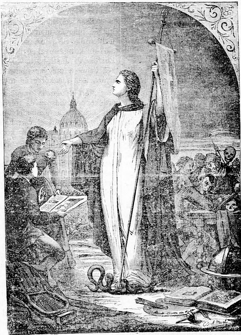
Gonoszság kigyója, vessz el!