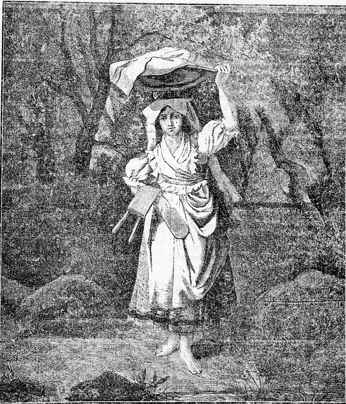
Ruhamosó nő falun.

„Magyar Néplap“ hetenkint háromszor a „Mezőgazda“-val Egész évre 7 fnt 20 kr. Fél évre 3 > 60 > Negyed évre 1 > 90 >