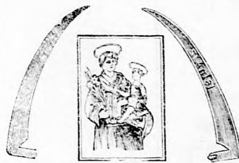
a Szent-Antal kasza.