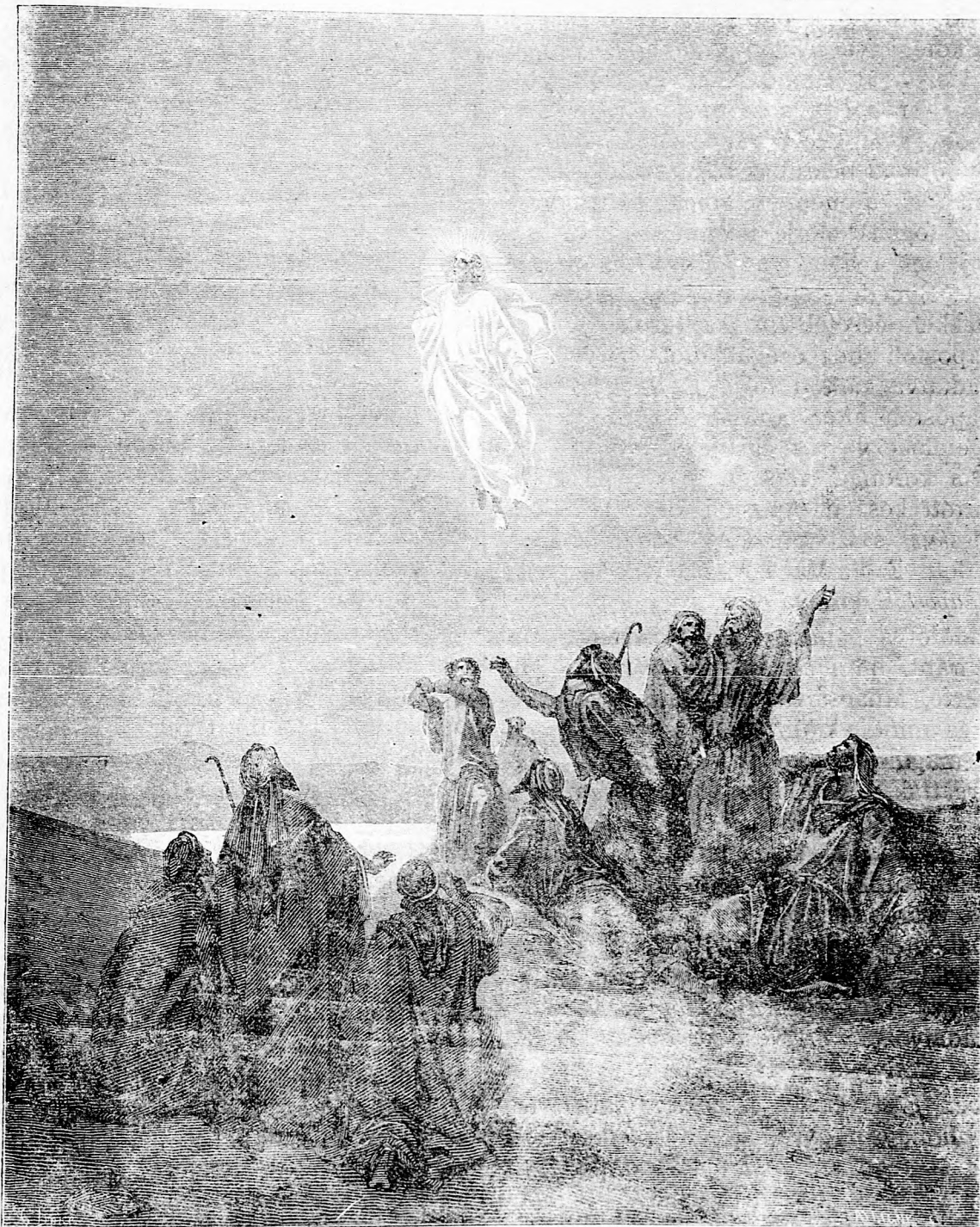
Urunk dicsőséges mennybemenetele.

„Magyar Néplap” — hetenkint háromszor a „Mezőgazda”-val: Egész évre 7 frt 80 kr. Fél évre 3 > 60 > Negyed évre 1 > 80 >