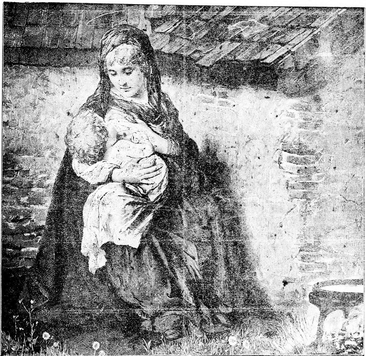
Mária menekül a kis Jézussal.

Keresztények! csak keresztényeknél vásároljatok!