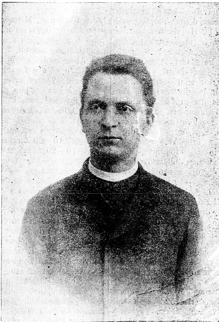
Majláth Gusztáv gróf erdélyi segédpüspök.

hozzá azt is megköveteli, hogy az adós arra a képviselő jelöltre szavazzon, a kit a takarékpénztár protegál, ez pedig csak kormány-