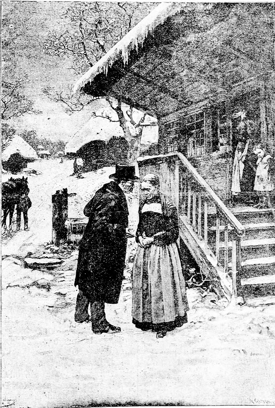
Ugy-e, kedves doktor ur, nem hal meg a férjem?

meg merte tenni azt a szörnyü vakmerőséget, hogy a fentnevezett zsidószabadkőmives újság cikkének hegyét a kereszténység szívéből elfordítá s a zsidóság felé irányította.