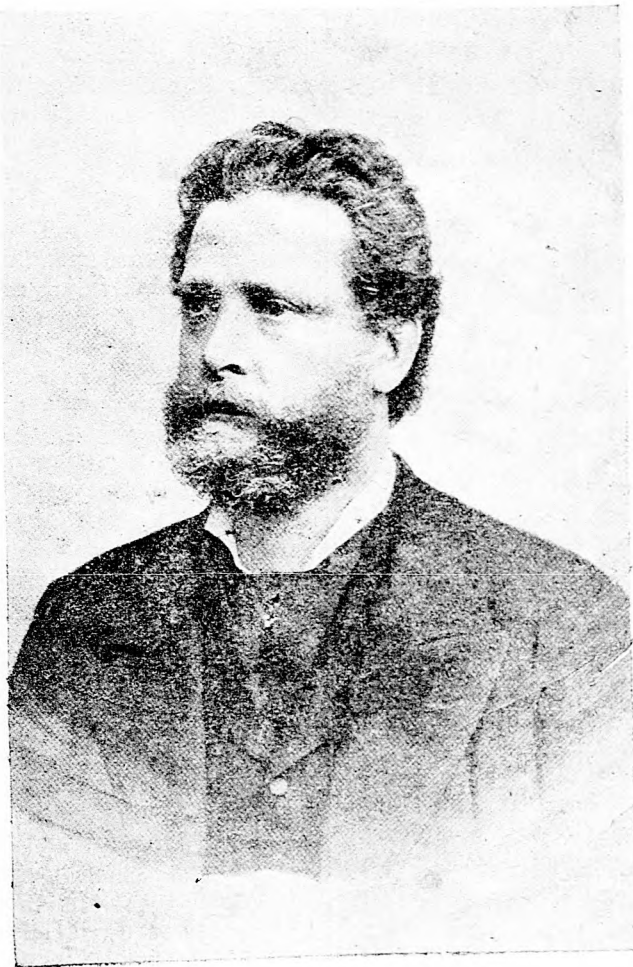
Dr. Lueger Károly Bécs város polgármestere.

A sötétség fiai, Belzebub szolgahadai, a szabadkőmives és zsidó hírlapok folytonosan azt