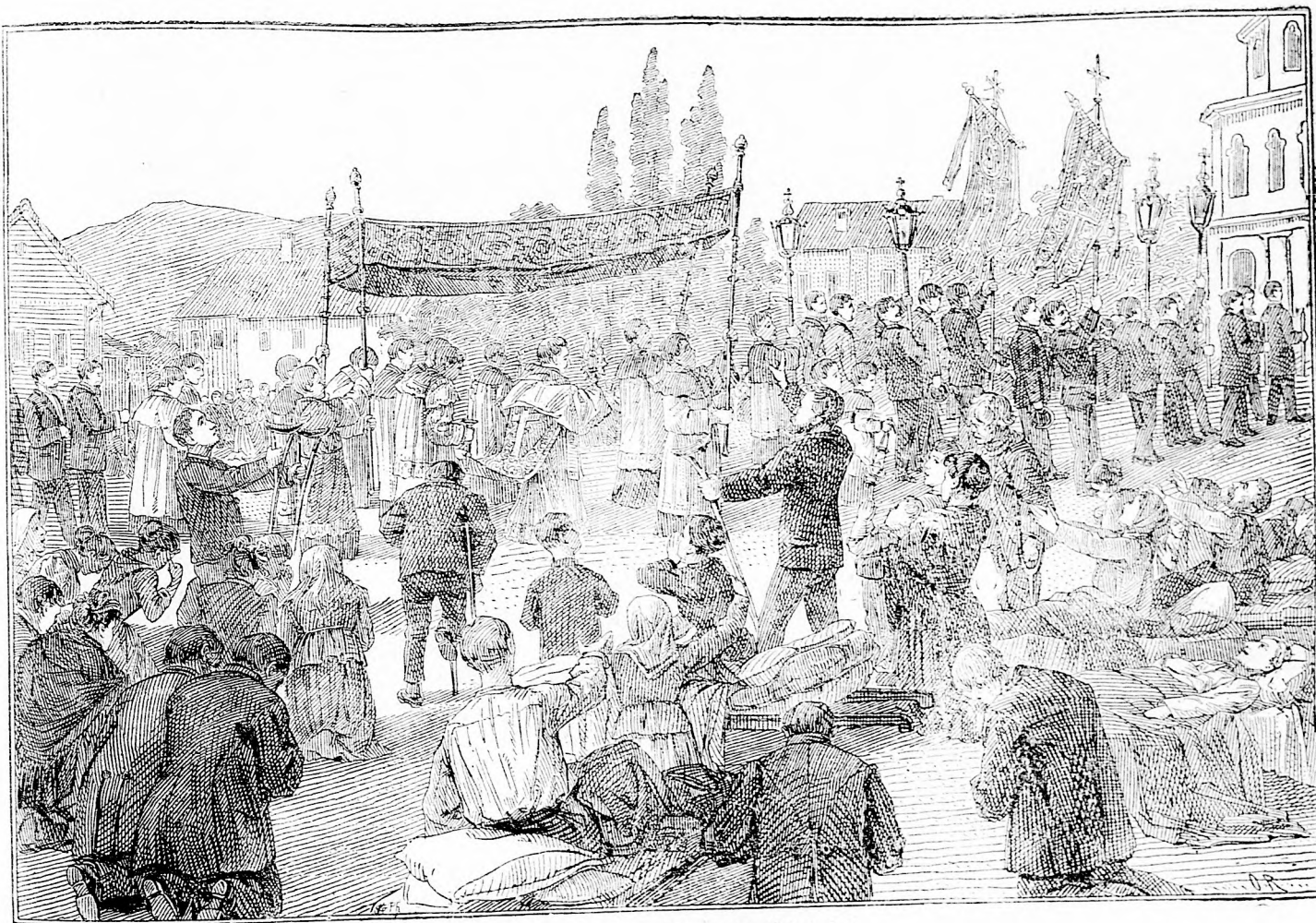
Máriát dicsérni, hívek! jöjjetek!

Keresztények! csak keresztényeknél vásároljatok!