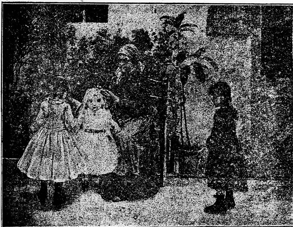
Az Ur Jézus elé.

A liberálizmus pedig uralkodik most már 31 esztendeje s ez idő alatt a viszonyok oly