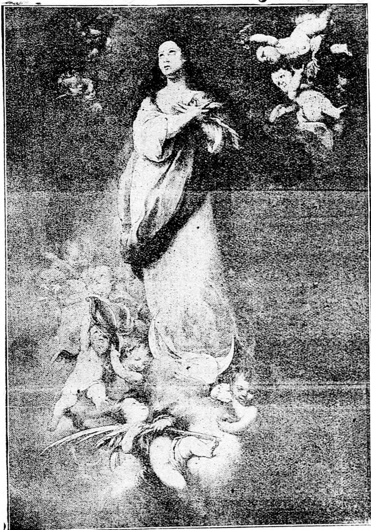
A szeplőtelen fogantatás királynője.