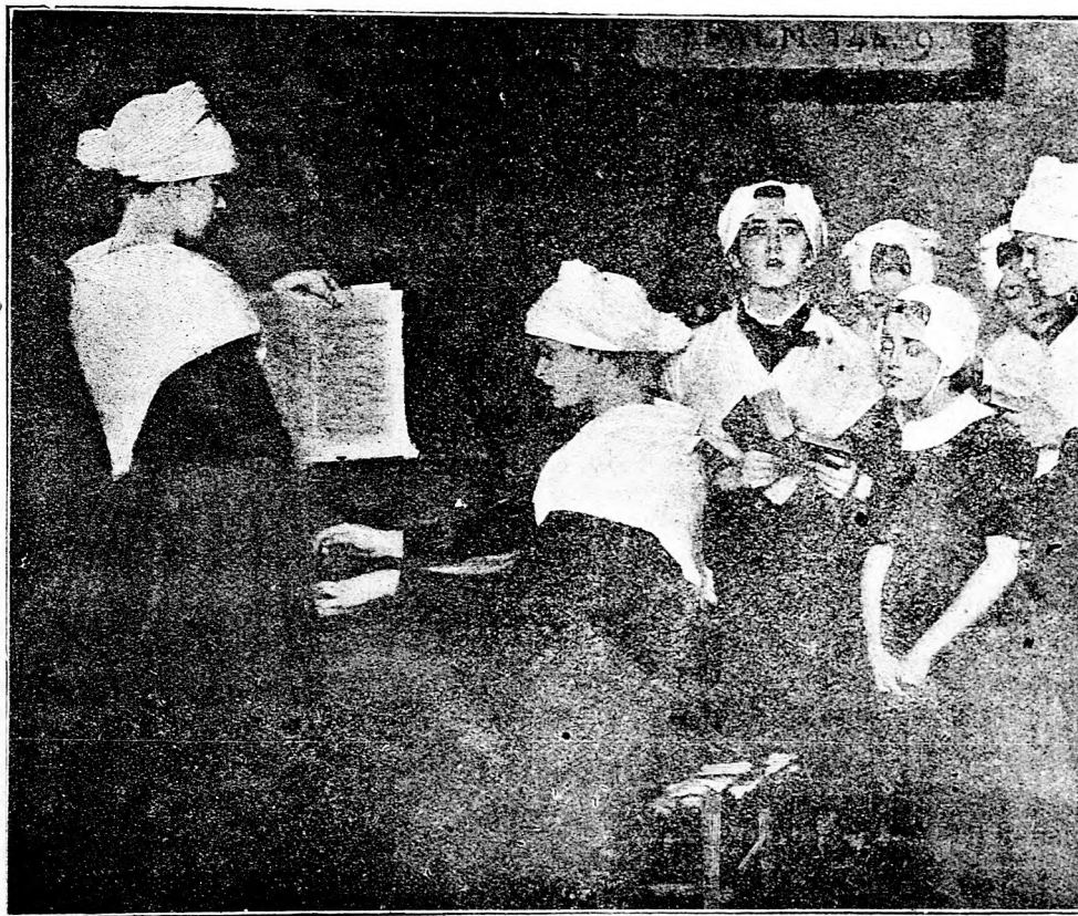
Készülődés sz. karácsony ünnepére.

Az Isten keze jól összezavarta a gonoszok dolgát. Zavar, bizonytalanság, fölfordulás van minden állapotaikban. Maguk se tudják: hogyan azóta Bánffy ur szekere teljesen elakadt. Ámbár a Tisza-család csatlósaival együtt neki vetette vállát a szekérnek, hogy kiemeljék a kátyuból,