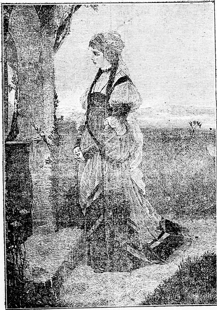
A halottak emlékéen.

Szerkesztőség és kiadóhivatal: Budapest, VIII., Práter-utca 44. Egy petsor hirdetés ára 10 krajcár.