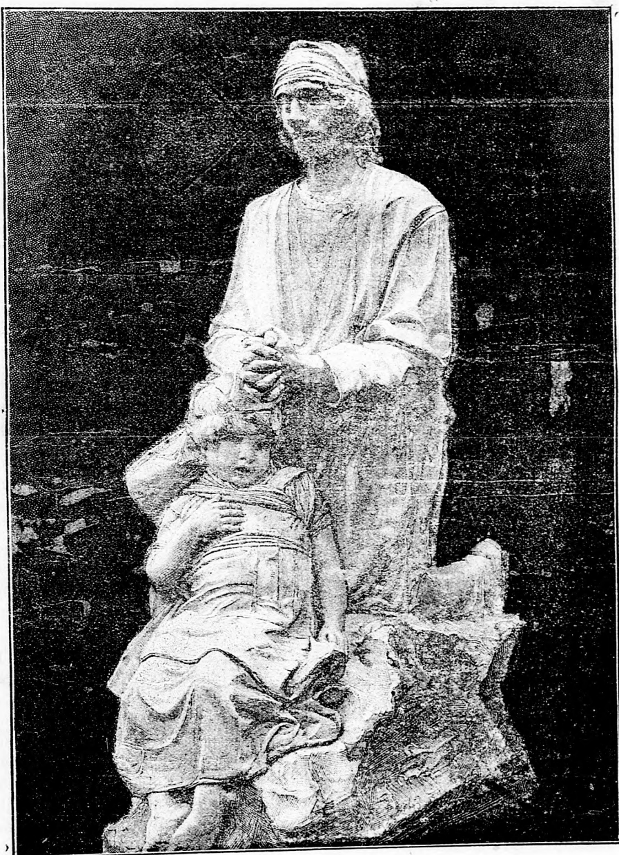
A vak koldus imája.

Mai számunkhoz „Előfizetési felhívás“ van mellékelve.