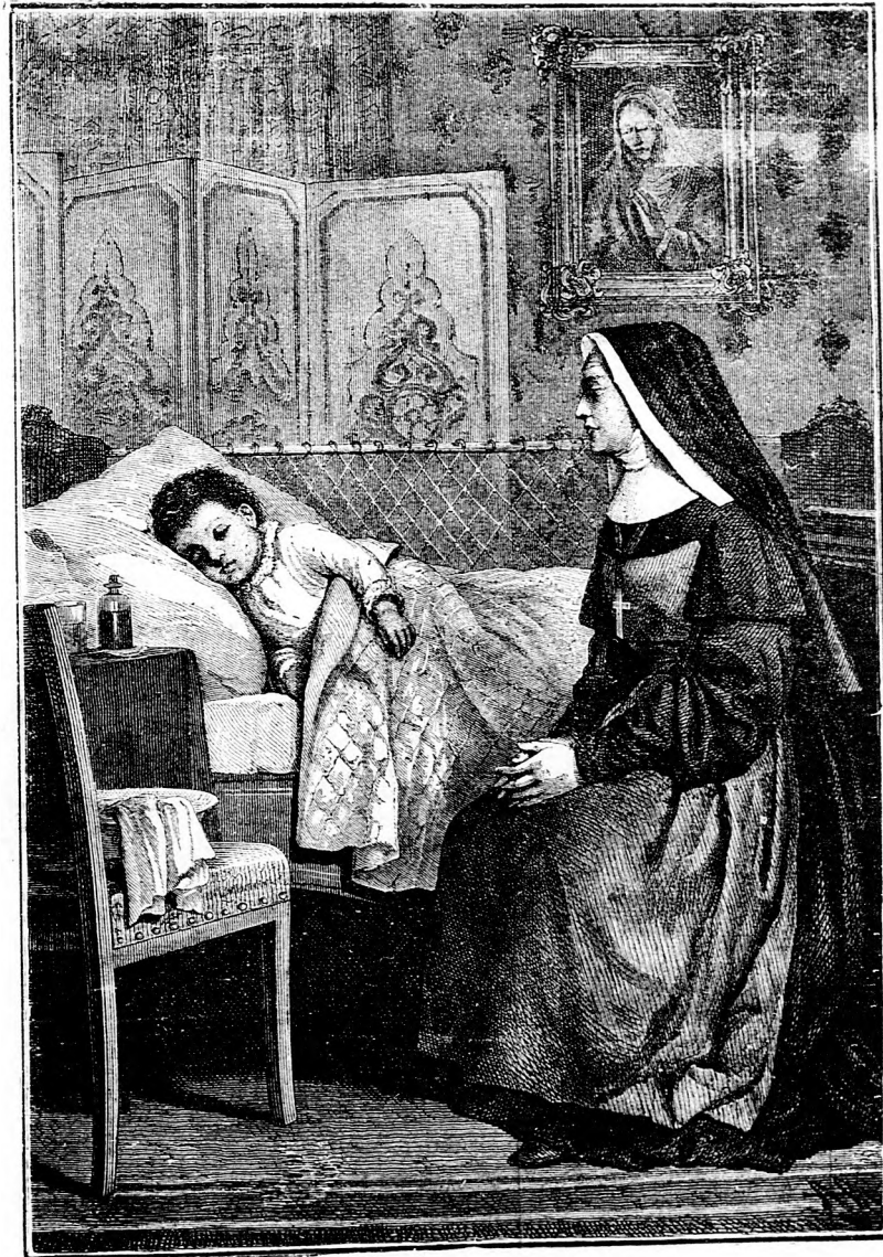
Órangyal a földön.

— Egy petitsor hirdetés ára 20 fillér. —