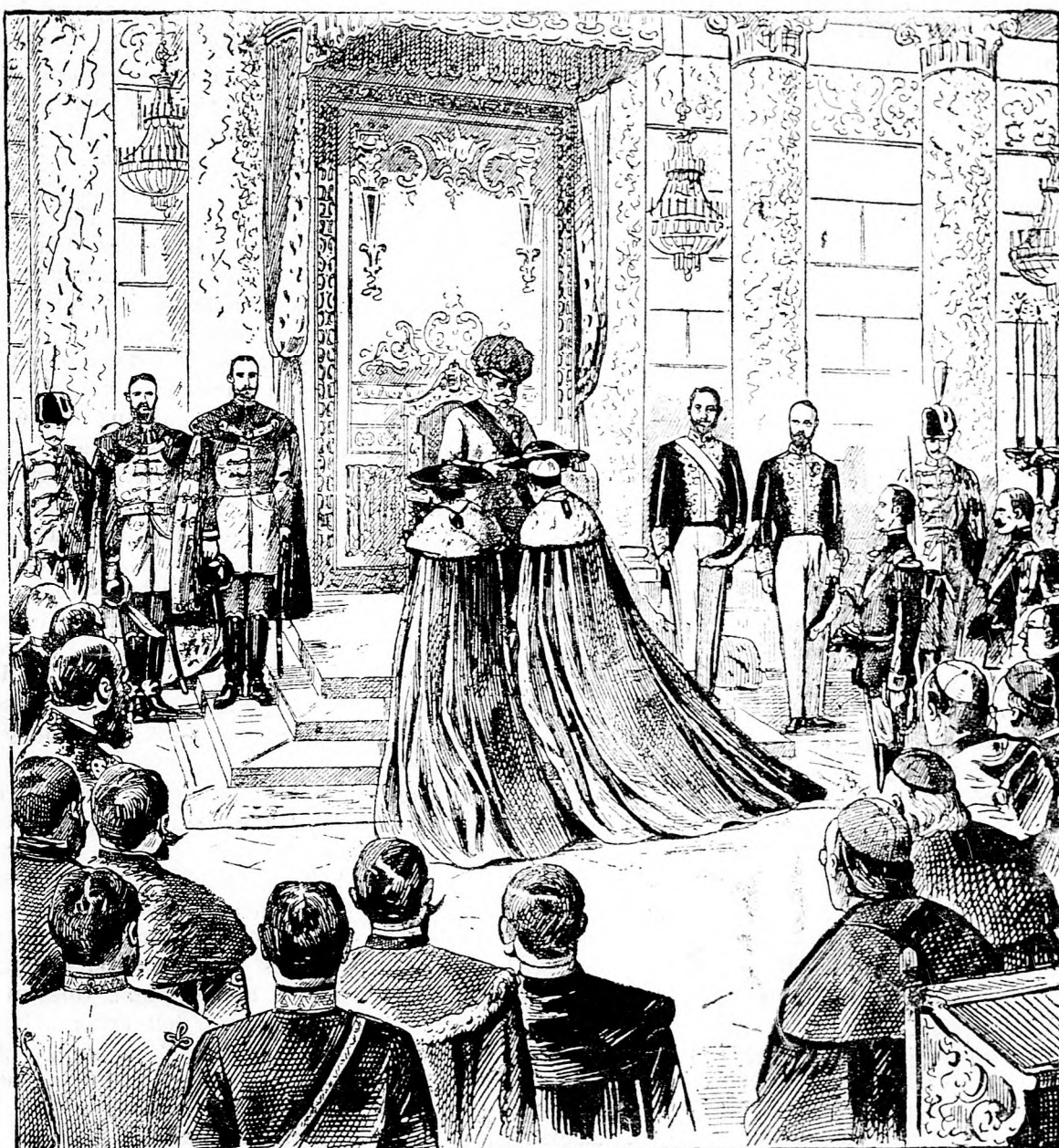
Bíboros-avatás a budai királyi palotában.

Európa egyéb államaiba és Amerikába egész évre 8 korona.