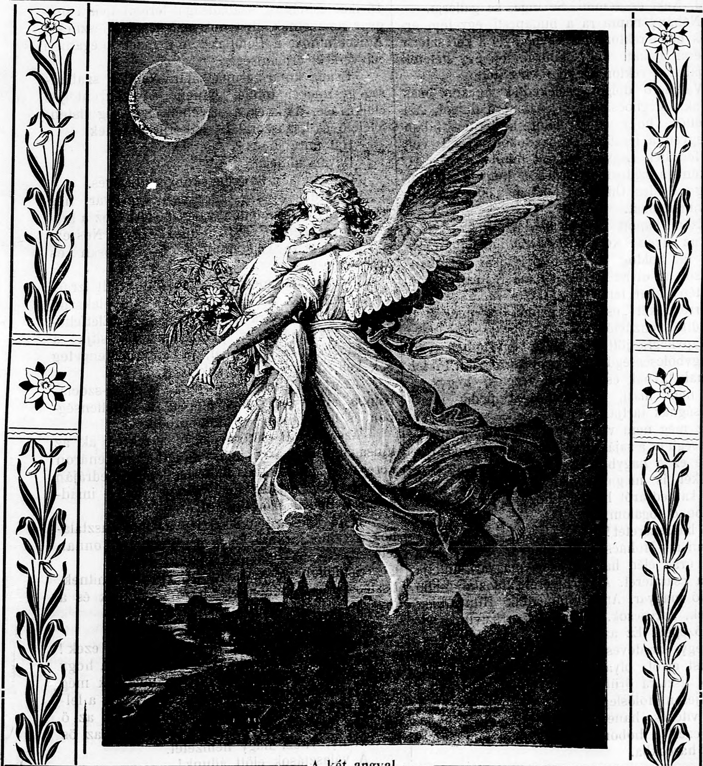
— A két angyal. —

Európa egyéb államaiba és Amerikába egész évre 8 korona.