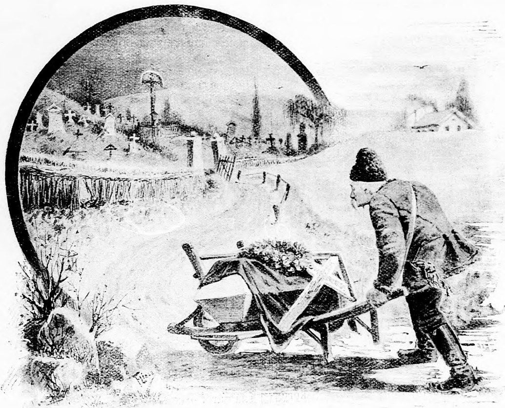
Rózsika utolsó útja.

A bankár hitetlenül rázta a fejét; nem tudta fölfogni észszel, hogy igaz az, a mit lát szemével. Aztán meg-