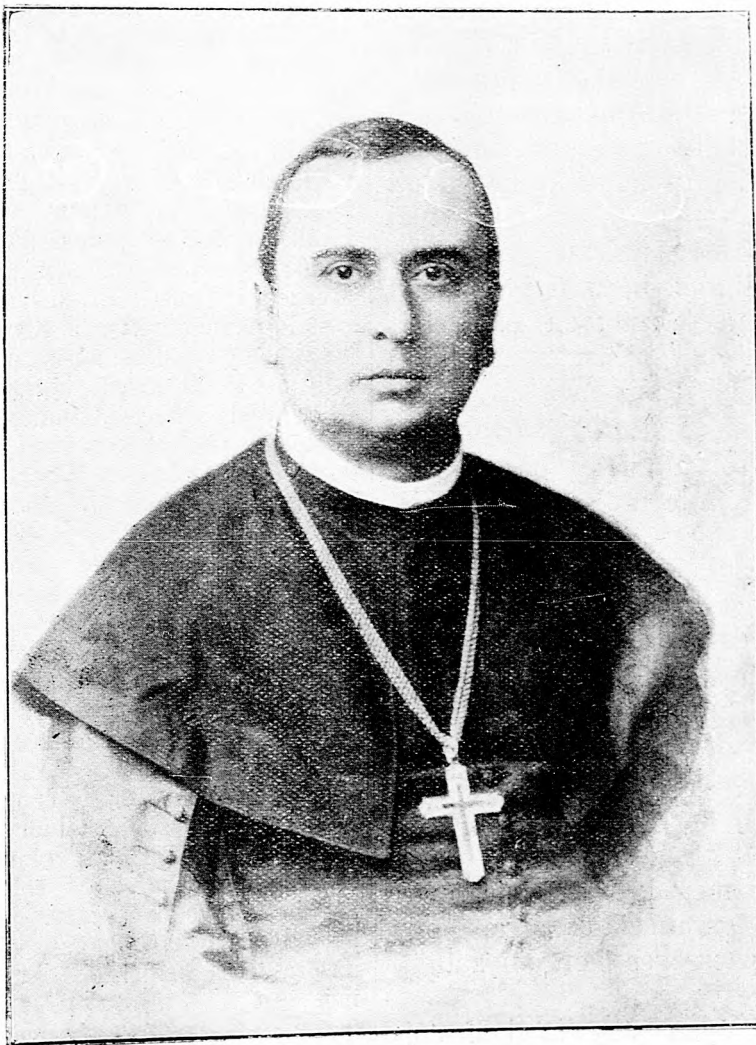
Doktor Várossy Gyula, székesfehérvári püspök.

A magasabb közérdek igenis hozhat olyan helyzetbe, hogy a nemzetért, a hazáért áldozatot kell hoznom, csak hogy akkor ezeknek az áldozatoknak a nemzeti közakarat parancsából kell