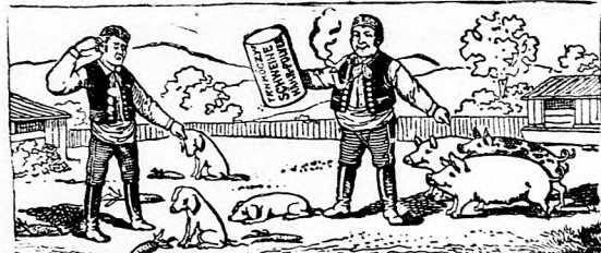
Nagy képes árjegyzék ingyen és bérmentve.

Minden sertésbirtokos megveszi a Trnkóczy dr. sertéstápport , mely minden kereskedőnél kapható vagy ha nem, úgy postán rendelendő. Trnkóczy gyógyszerháza Laibach, Krajna. 1 csomag 50 fill. 5 csomag 2 kor.