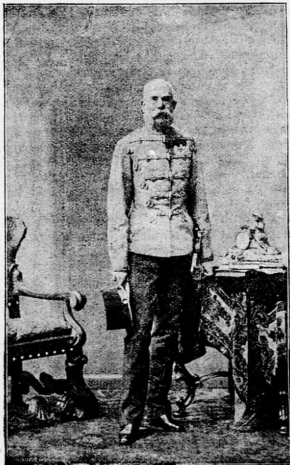
I. Ferencz József magyar király.

Ez a kép azon angol testőrezrednek készül ajánlékba, melynek I. Ferencz József a tulajdonosa. Este bál volt a budapesti tisztiek kaszinójában és arra megjelent ő felsége is. — Hétfőn volt az első általános kihallgatás, melyre sokan-sokan jelentkeztek főpapok, zászlósurak, katonatisztek, képviselők stb. A kik december óta különféle kitüntetések kaptak, mind most jöttek el köszönetet mondani. A király mindenkit nyájasan, kegyesen fogadott, különösen sokáig eltársalgott Giffing Vilmos főhadnaggyal, a ki a katonai érdemrendet kapta, mert Székesfehérvárott egy megörült bakát tett ártalmatlanná, ki háborodottságában katonatársait lövöldözte meg szolgálati fegyverével. A bátor főhadnagy elszántan rá-