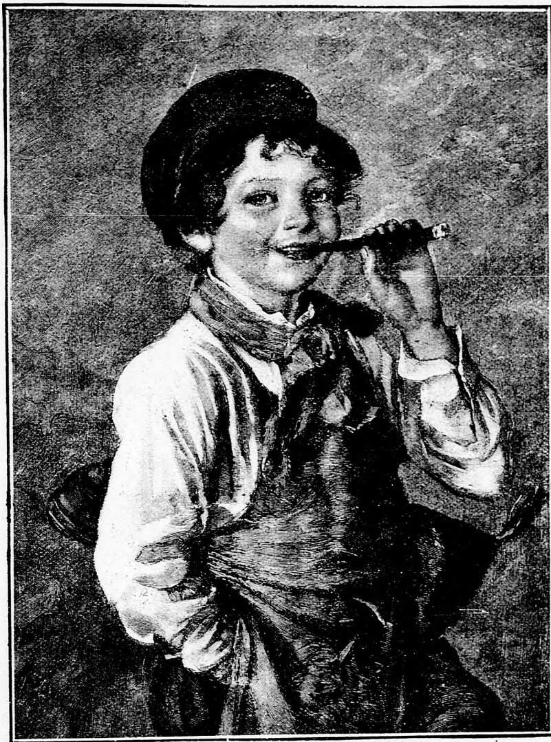
Kinek vigabb az élete?

Az almamoly elleni védekezés. Almatermésünknek egyik legnagyobb ellensége az almamoly, mely az almának elférgesedését és hullását okozza. Most az almamoly