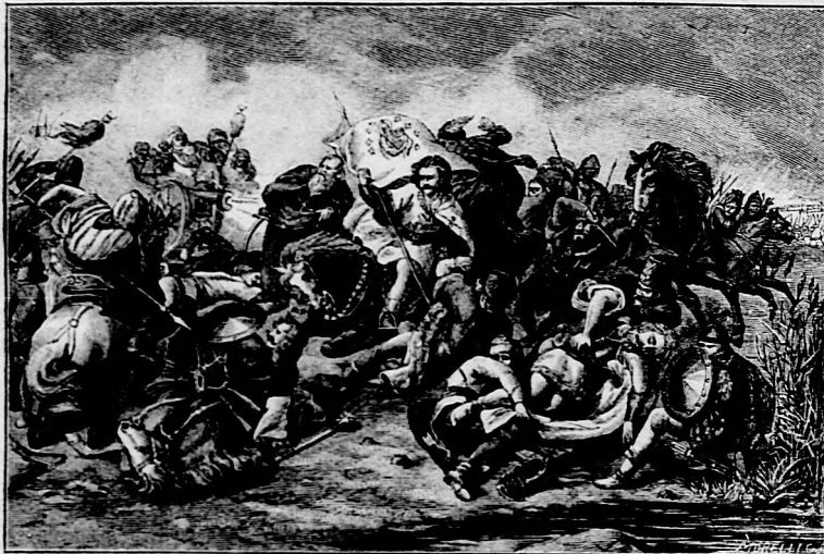
A mohácsi csata 1526 augusztus 29-én.

Itt folyt le a nagy és nevezetes csata a sikon. Itt ütött tábornak a magyar sereg és várta a törököket. Nagy volt a félelem, de azért mindenki úgy tett, mint az az ember, a ki a sötétben füttyül, hogy a félelmet elfelejtse. Mindenki sejtette, hogy valami borzalmast fog megérni, de mindenki remélt. Közben az a vigasztaló hír érkezett, hogy a török had rendezetlen, hogy a magyarok egy kis ügyességgel könnyen győzhetnek... csak hogy hol volt az ügyes hadvezér? Hirtelen megtették a sereg fővezérének Tomori érseket. Azután csak tovább fejetlenkedtek. Az egyik fél szekerekkel akarta a tábornak elsáncolni, a másik ellene szegült, mert «nyílt sikon bátran» akart harcolni. Az egyik rész azt mondta, hogy ne hamarkodjunk el a dolgot, várjuk be Zápolyait az erdélyi, Batthyány Ferenczet a tótországi hadakkal, de a dicsvágyók «egyedül és most» akartak megütközni. Nem tudták tartóztatni magukat. Az óriási harcviág nem lelkesedés volt, hanem a halál előérzete. Ha hazaszeretettől, igazi lelke-