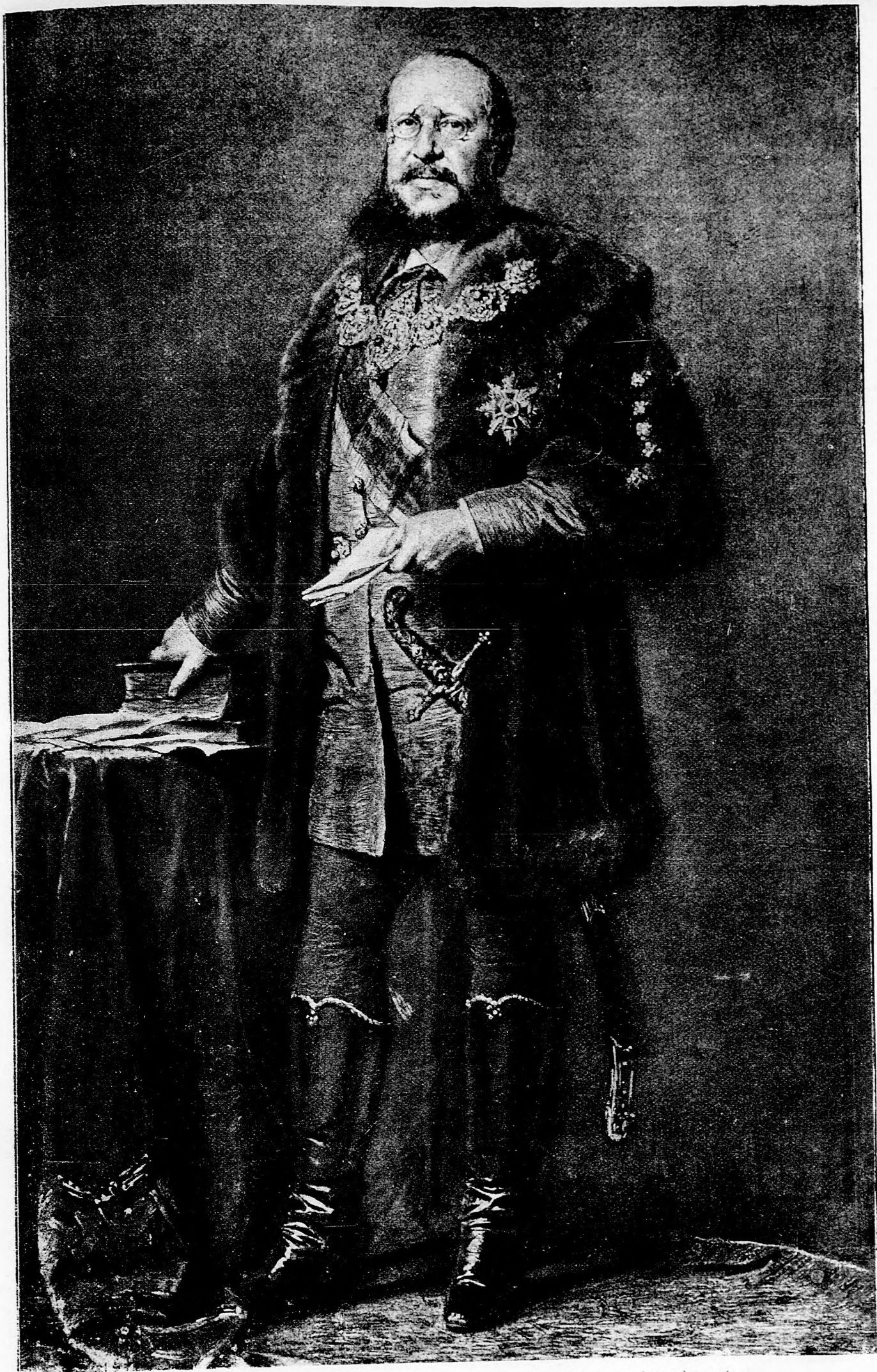
Széll Kálmán magyar miniszterelnök és belügyminiszter, a Szent-István-rend nagykeresztese..

z idő nnak nk a z uj zen- szül- kete- . De