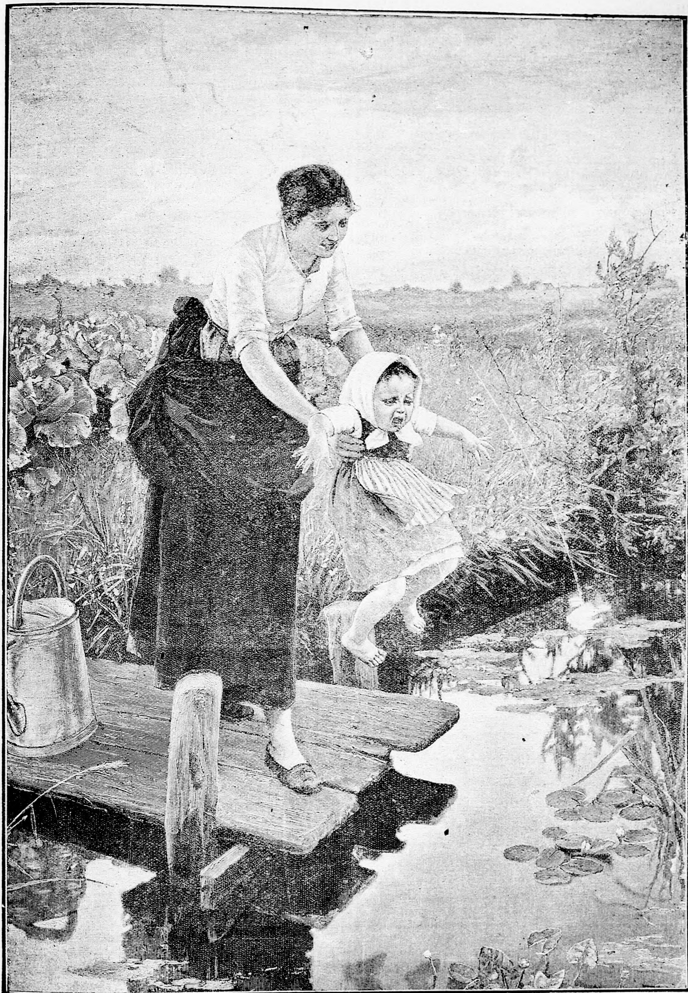
Nem kell félni, amíg anyácska kezét érzed!