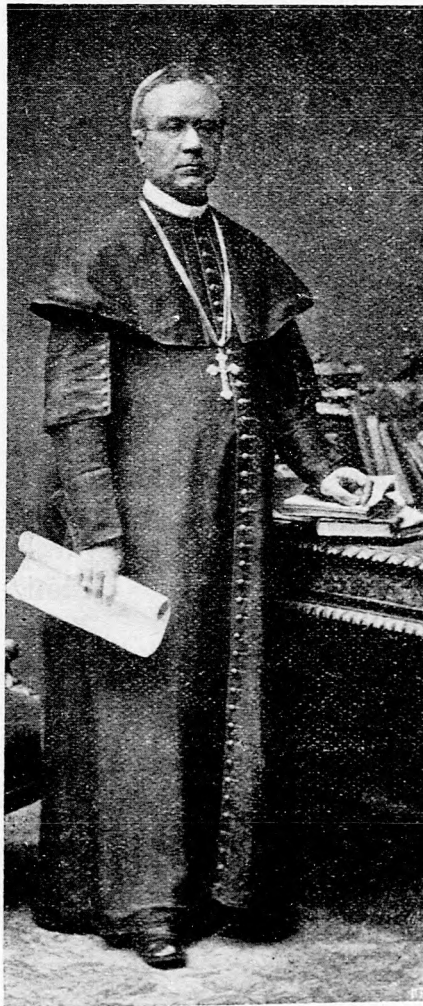
Samassa József, az aranyimisés egri érsek.

Maga a börze nyár derekán mindig csendes, mert azok a nagy börziánerek nem állják ki a fővárosi meleget, hanem elutaznak a külföldi tengeri fürdőkre hűselni. Most tehát nem ők maguk, hanem apróbb kufárok rontják ott az árat, akik krajczáros nyereséggel dolgoznak. A komittensek járnak faluzni buzáért, ők aztán a másodrangu