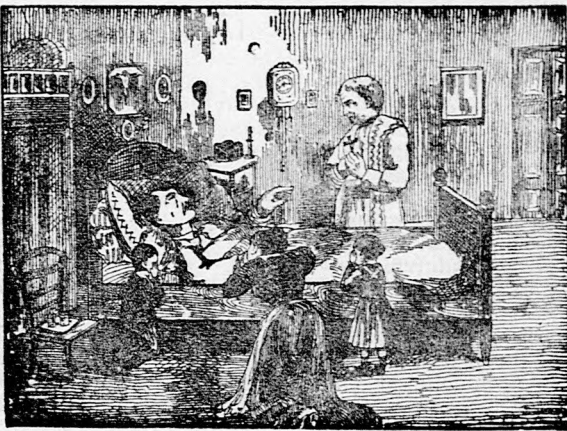
Azt mondta: „Nekem semmi sem használ már, hagyjatok békében meghalni!”

nyáján meggyőződtek, hogy a valódi Feller-féle Elsa-Fluid teljesen és gyorsan gyógyít rheumat, dagadt lábakat, vesebajt, daganatokat nyilalást, lázt, köszvényt, láb és kézbenulást, szivdobogást, légzési zavarokat, fülzugást, fogfájást, a száj rossz szagát, különösen szemgyöngeséget és idegbajt, gége és torokbetegségeket, skrofulózt, sebeket, megfagyott testrészeket, orbánczot, pörsenéseket, szemölcsöt. Az emberek a Feller-féle Elsa-Fluidot a gyermekeknek adták sárgaság, láz, bárányhimlő, rekedtség, köhögés, giliszták ellen, ezenkívül bekenték Feller-féle Elsa-Fluid-dal, ha gyermekeiknek kiütéseik voltak a testükön vagy arczukon, sőt ha ótváros volt a fejük és mindig használt a Feller-féle Elsa-Fluid. — Nekem nagy örömet okozott barátom