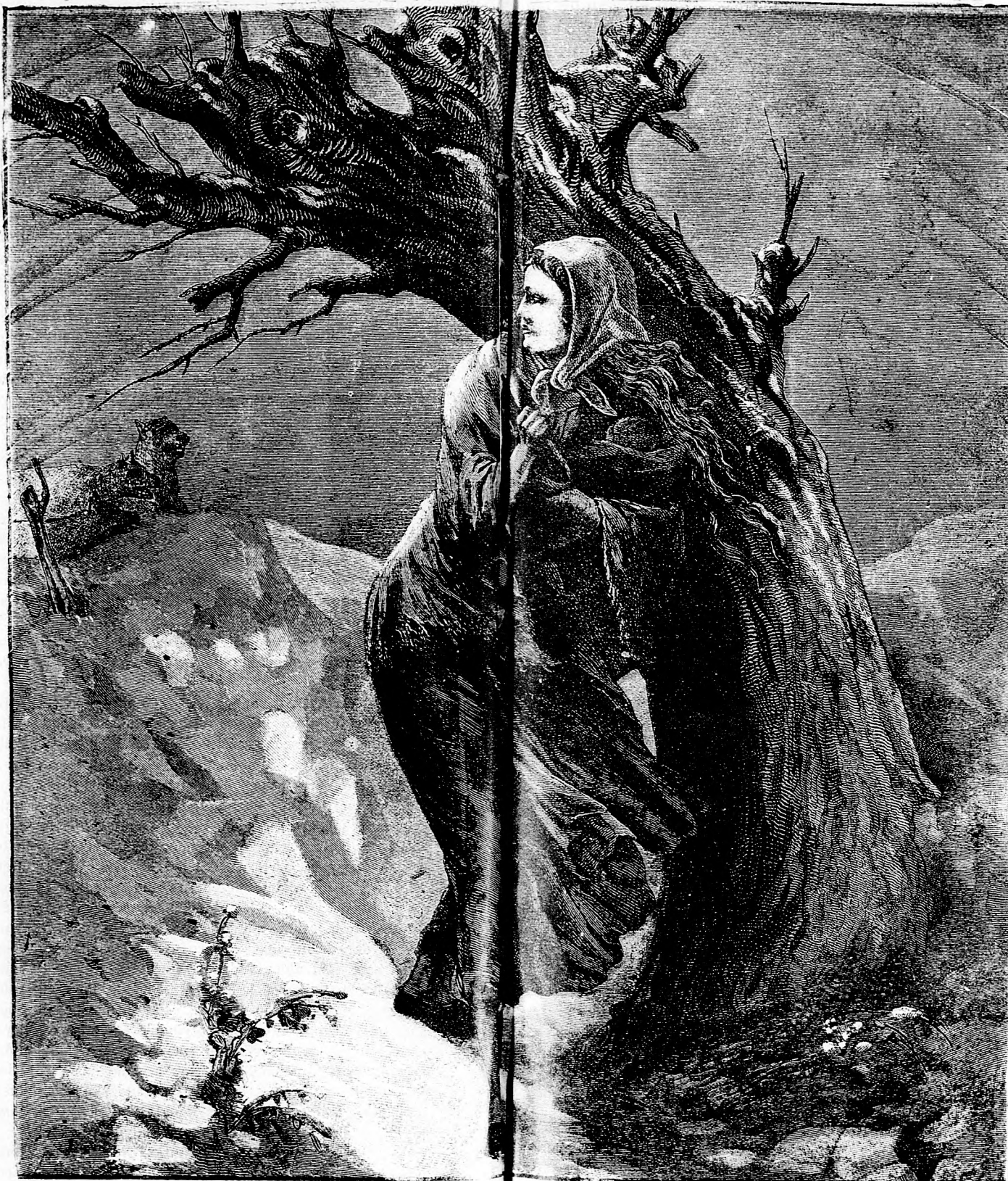
A sz. szöveg.

Összeköttetés a föld és a csillagok között. A természettudósok föltételezik, hogy a csillagok is élő lényekkel vannak benépesítve s ezen alapon már régen foglalkoznak azzal a kérdéssel, miképpen lehetne valami módon érintkezést létesíteni a föld és egyes csillagok között? E kérdés megoldására most egy vagyonos francia polgár százezer frank pályadíjat tűzött ki, mely összeget az a tudós nyeri el, ki a tudományak ezen kalandos terén eredményt tud felmutatni. Néhány évtized előtt már megpróbáltak ilyesmivel, a midőn óriási tüzeket raktak Afrika lakatlan sivatagjain, hogy azt más égi testek lakói észreveggyék és viszonzozzák. De bizony eredménytelenül. A százezer frankos díj talán megint életre kelti a félben hagyott kísérletet, bár nincs reá valószínűség. Az emberek okosabban tennék, ha a föld és a menyország közötti vallási összeköttetést erősítenék, mely ugyanis laza.