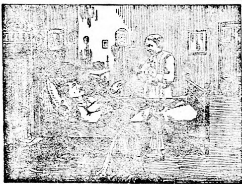
hagyjatok békében meghalni!