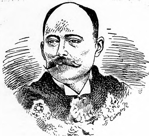
Lukács László pénzügyminiszter.