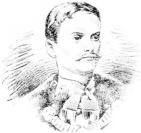
Ta'lian Bela földmivvelésügyi miniszter.

Csak figyeljük ezt meg a mindennapi életben!