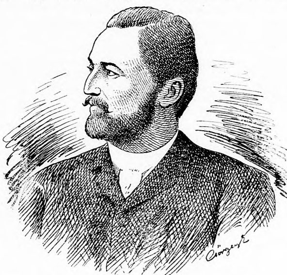
Gróf Tisza István miniszterelnök és belügyminiszter.