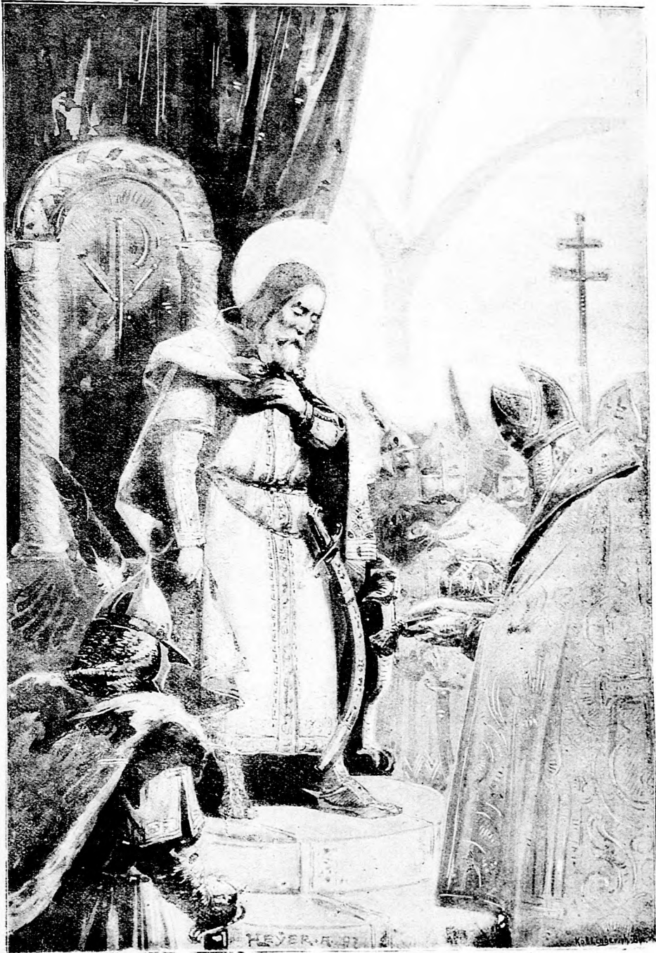
Asztrik püspök átadja szent Istvánnak a Rómából hozott koronát.

tűzkárnak csak ezredrészét téríti is meg a magyar ipar támogatásával. A kiállítás a városi Iparcsarnok hosszú főhomlokzatának tágas termeiben van. A kaputól balra eső teremben pálmák közt áll a mellszobra József királyi hercegnek, a magyar tűzoltók fővédőjének, továbbá ott a szobra Széchenyi István grófnak, meg a két tűzoltó-Széchenyinek, Odön basának, a konstantinápolyi tűzország fejének és Viktor grófnak, a magyar tűzoltók vezérének. Szép mintázata van még ebben a szobában Holló Barnabás szobrásznak: égő házból alélt fiatal nőt hoz le a karján az életmentő tűzoltó. Ebben a teremben van a kiállítás muzeumi része, sok min-