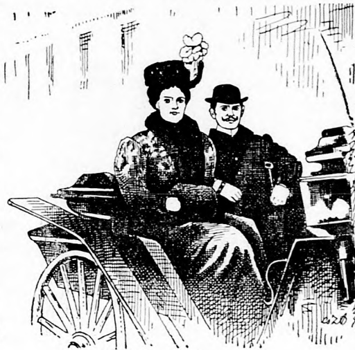
Grófné és cigányprimás.

Építkezést a reklám czéljaira leg- inkább a szállodák használnak. Csak nem régen épült egy szálloda a kikötő közelében, mely 24 eme- letes és külön jéggyár, meg külön nyomda van benne, hogy diszesebb legyen az étlapja. De még ezen is tul tesz az Atlantic City nevű ten- geri fürdőnek legújabb szállodája, mely az elefánthoz nemcsak czi- mezve van, és nemcsak czégtáblá- ján van kipingálva az ormányos állat, mint nálunk szokás, hanem maga az egész ház egy elefánt alakjára van kiépítve, hátán pala- kinnal, vagyis azzal a kosárral, a melybe ülni szokott, ki elefánton utazik. A szálloda ablakai az ele- fánt hátán és hasán vannak, min- denik lábán egy lépcsőház és fel-