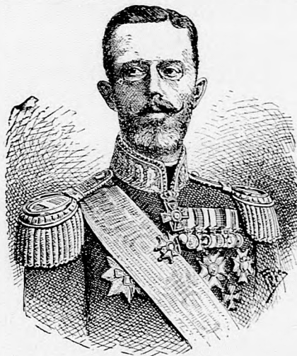
V. Gusztáv, az új svéd király.

Feltűnő jegye az imént megújult esztendőnek az általános választói jog. Erre szót adott minden tényező, kinek kezében fekszik nemzetünk sorsa. Királyi ajk hirdette ki elsőnek, hogy megértette a kor haladó törekvését és mintegy előírta kormányunknak, hogy az előkészítést most már gyorsabb tempóban végezze el. A nemzeti kormány egy lépéssel tovább is ment; bejelentette, elé is adta a törvénytervezetét, mely a választói jogot sokkal nagyobb mértékben terjeszti ki, mint a mennyire a nyugati