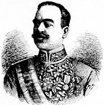
Ferreira, portugál miniszterelnök.

Arany János szobra. Nagykőrös városa elhatározta, hogy Arany Jánosnak, a nagy költőnek, ki az ottani főiskola tanára is volt, szobrot állít. A nem egészen három hetes gyűjtésből 7760 korona gyűlt be.