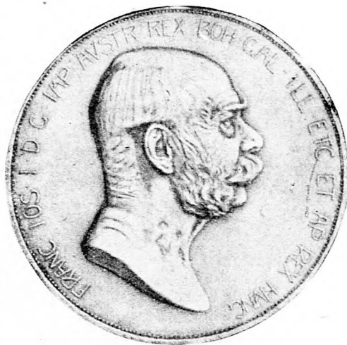
Királyunk jubileumi pénze.

Hát miért nem elégítik ki a magyar nemzet jogos követeléseit katonai téren? hiszen ha ez megtörténik, semmi se állja útját a hadsereg kellő fejlesztésének.