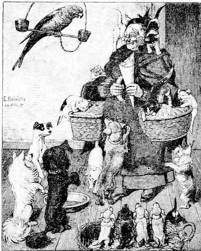
»Tetszik tudni, fölötte kedvelem az állatokat.«

az élet vásári tülekedésében egyszer jön egy erősebb, a ki az ő szájából kiragadja a szegényes napi falatot. Hogy a toll egyszer kiesik kezéből, a test felmondja a szolgálatot, mi előtt a lélek is elszállni kész. Hogy jön idő majd egyszer, mikor még élnie kellene s nem lesz miből. Ha tudná, hogy a mit ő uri színnek nevez, pusztító betegsége sápadtsága, melyet a hivatali akták pora oltott bele, a zuglakások fertőzött levegője táplál — ha tudná, hogy fiának uri állapota igazi czifranyomoruság, visszasírná a napot, melyen