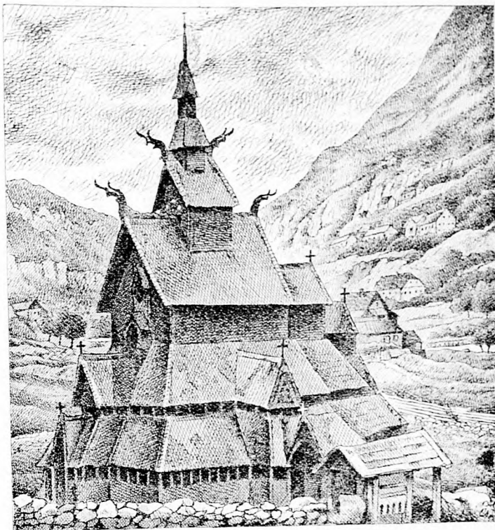
Az ősrégi fatemplom Norvég-Borgundban.

A czár és Rosevelt. Amerika erősen fegyverkezik és sok áldozat árán kivált a hajóit szaporítja. Mindenki tudja, hogy ennek éle Japán ellen irányul. Ezt a kis szigetországot, mióta az orosz őrjárat legyűrte, két nagy állam vette célba: Kína