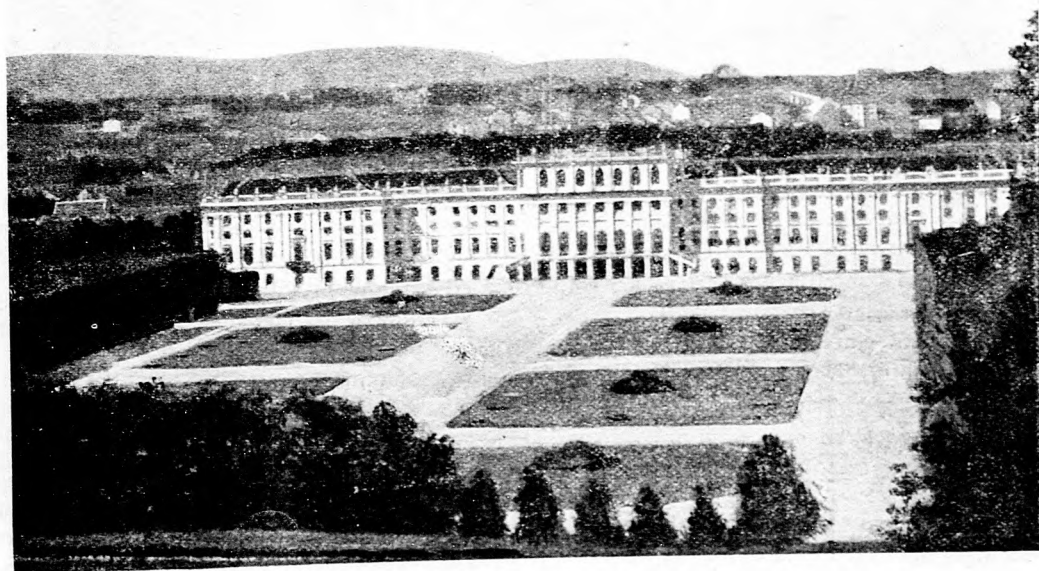
Királyunk kedvenc lakhelye: A császári kastély Schönbrunnban.

Mi céljuk van vezéreinknek ezen új párttal? Rövid feleletet tudhatnánk rá, ha azt mondanó, hogy régi szükség, régi óhaj, mikép ne szakadozzék folyton pártokra a magyarság, mikor annyi a külső és belső elienségünk. De azért is kívánságos az új alakulás, mert a hosszú közjogi tusa, mely Magyarország erejét hatvanhét óta sorvasztja, gátat vetett minden gazdasági és szociális tevékenységnek. Ha unos-untalan azt kell bizonyítgatni lefelé, felfelé, megkifelé, hogy közülünk melyik az igazabb magyar, melyik a királyhűbb magyar, melyik a tizenhárom pró-