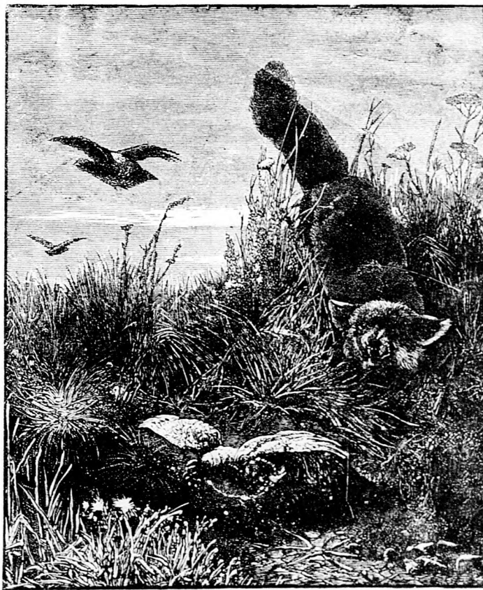
Róka-irtás mérgezett tojással.

Jobbára az ellenzék nehéz kenyerét ették addig. Mikor pedig a kormányra kinevezést kaptak, nem az volt a marsrutájuk, hogy tegyetek hát a meggyőződés szerint, hanem csak az, hogy utasítást és kötött szoros feladatot teljesítsenek. — Egy bűnös és átkos rendszert kell elsőbb kiirtaniok, így a közélet tisztaságának helyet csinálniok, azután sok