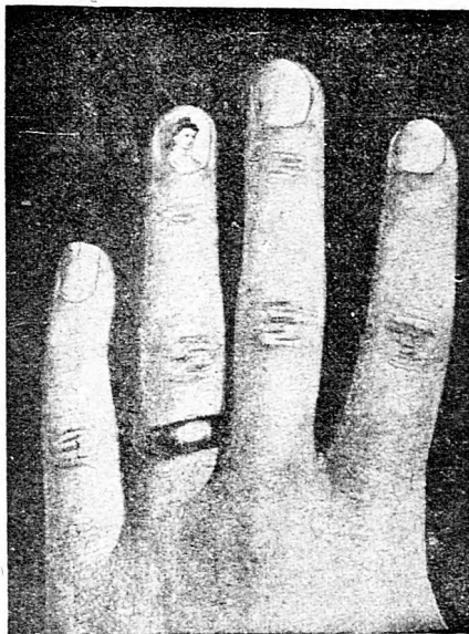
Amerikai kedvtelés. Arckép a körmön.

tott le a feltaláló gróf, melyben írta, hogy a Rajna partjára iparkodik és megnevezte a városokat, miket érinteni fog. Mindegyiket el tudta érni. Szállt egyenesen, kitérés és fölösleges himbálás nélkül. Senki sem érezte a talaj hiányát. A kísérletében levő mérnökök, műszerészek, valamint néhány intimus barátja közül senki se érzett rosszullétet, valami tengeri betegség