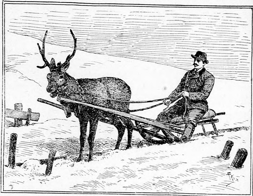
Szánkóba fogott szarvas.

A bosnyák kutak megvizsgálása. Székesfehérvárról írja tudósítónk: Egy székesfehérvári 69. gyalogezredbeli katona, a ki mostanában került le Boszniába, Bilekből levelet irt haza. Ebben elmondja, hogy december közepén hire ment a táborban, hogy több montenegrói ember átszökött Boszniába, a kiknek az volt a föladatuk, hogy az összes