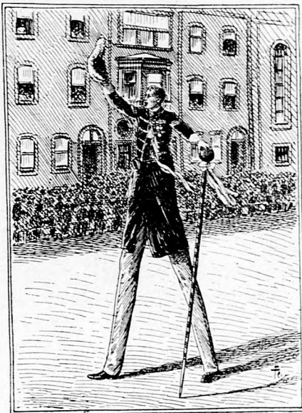
Ujév reggele Filadelfiában.

Hanem Szilveszter éjszakáján hivatalos erény lesz a csapongó jókedv. Ilyenkor azok is a lármázók közé keverednek, kik egész éven át még a dalt se szívelik. A hamisítatlan jókedvü czimborák azonban ferde szemmel nézik ezen évente