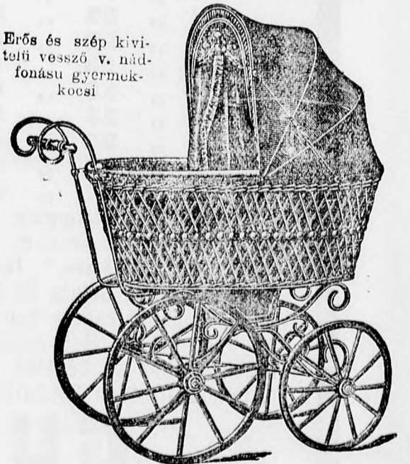
Erős és szép kivitelű vessző v. nád-fonású gyermek-kocsi