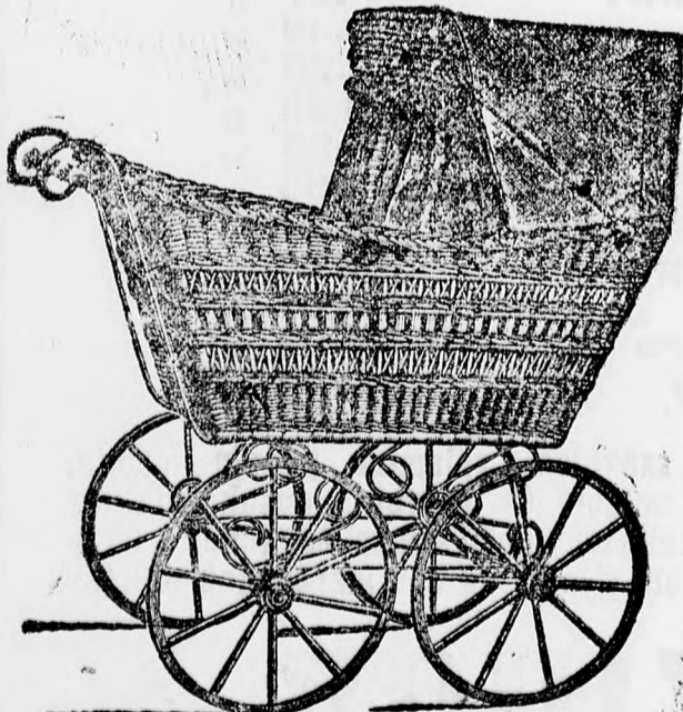
Erős, fonott kocsi frt 7, 8 és 9.