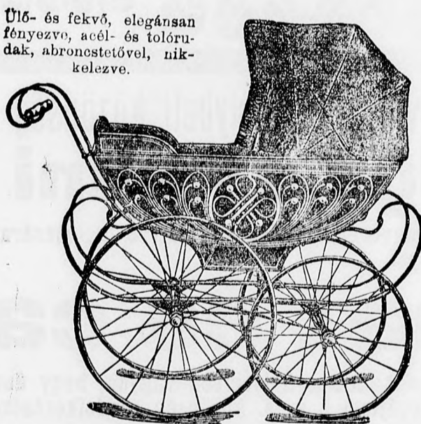
Ülő- és fekvő, elegánsan fényezve, acél- és tolórudak, abroncsokkal, nikkelezve.