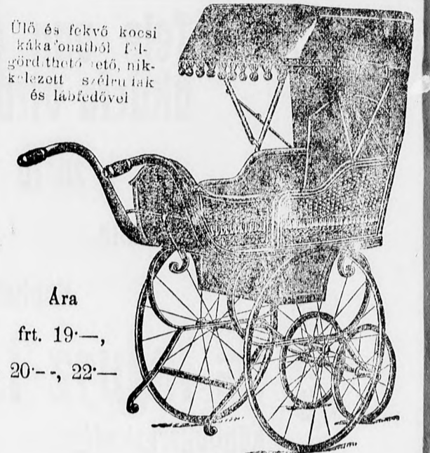
Ülő és fekvő kocsi kákaonathöl felfoldható tetővel, nikkelezett oldalkaratokkal és lábfedővel