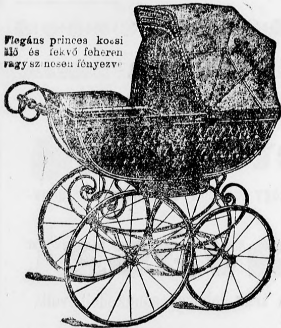
Elegáns princes kocsi ülő és fekvő fehérén vagy színesen fényezve