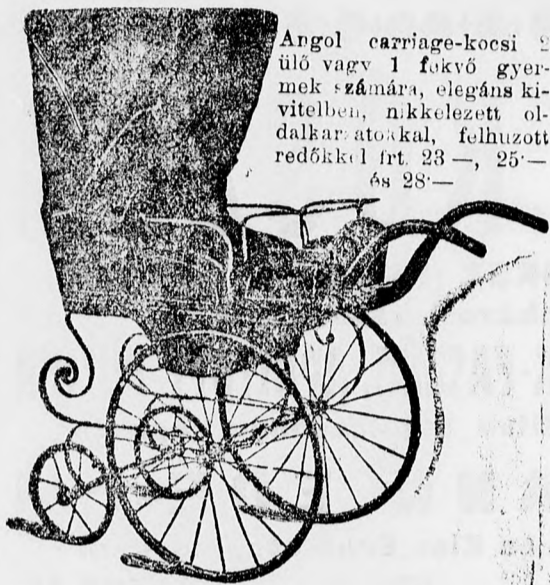
Angol carriage-kocsi ülő vagy 1 fekvő gyermek számára, elegáns kivitelben, nikkelezett oldalkaratokkal, felhuzott redőkkel frt. 23'—, 25'— és 28'—