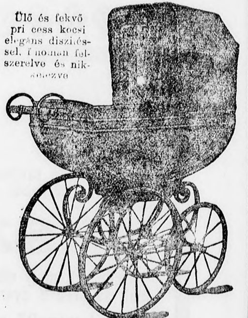
Ülő és fekvő pri cress kocsi elegáns díszítés-sel, fémnán fel-szerelve és nikkelezve