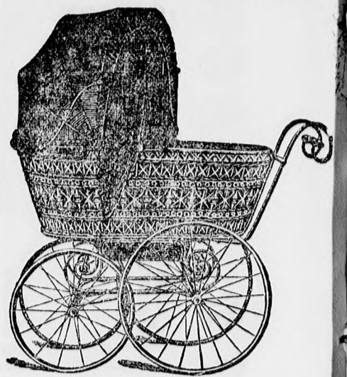
Finom ülő és fekvő kocsi fehérén, vagy színesen akkírozva, frt. 15'—, 16'—, 17'—