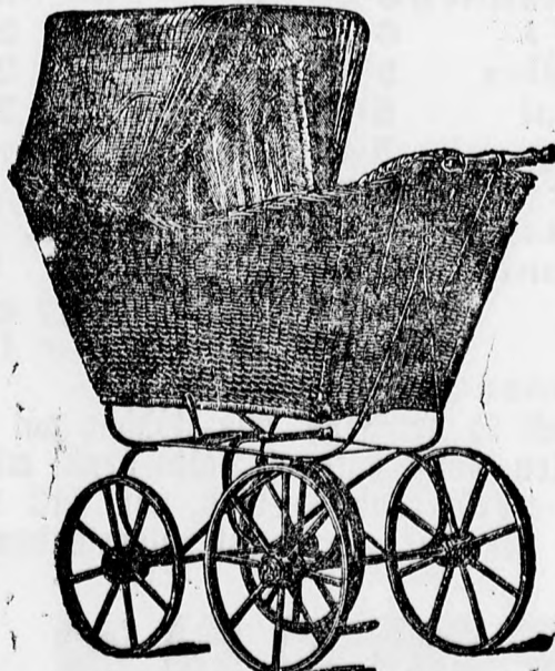
Egyszerű kivitelű kocsi frt 5, 6 és 7.