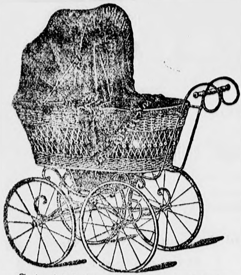
Szép kivitelű tartós ülő és fekvő kocsi frt. 12'—, 13'—, 14'—