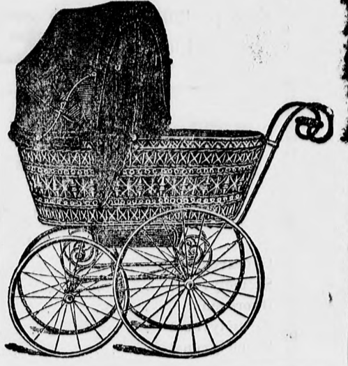
Finom ülő és fekvő kocsik fehérre, vagy színesen akkírozva. frt. 15-,-, 16-,-, 17-,-

Ujdonság! Cégemnek különlegessége. Átalakítható ülő és fekvő-kocsi legfinomabb kivitelben, frt. 35-,-tól 50-,-ig.