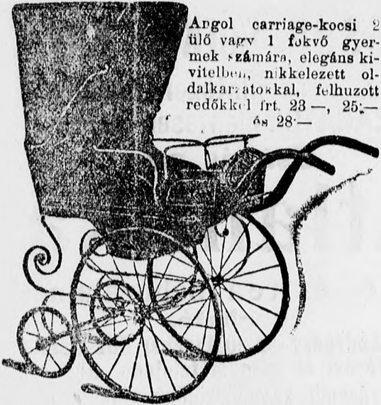
Angol carriage-kocsi 2 ülő vagy 1 fekvő gyermek számára, elegáns kivitelben, nikkelezett oldalkar: atoskal, felhuzott redőkkel frt. 23-,-, 25-,- és 28-,-