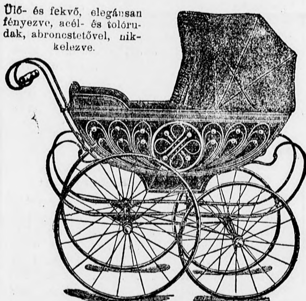
Ülő- és fekvő, elegánsan fényezve, acél- és tolórudak, abroncsotétóval, nikkelezve.