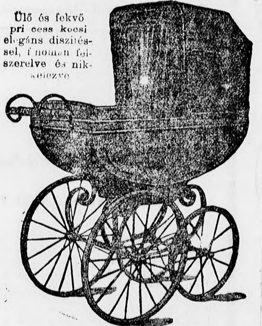
Ülő és fekvő pri coss kocsik elegáns díszítéssel, ironium felszerelve és nikkelezve