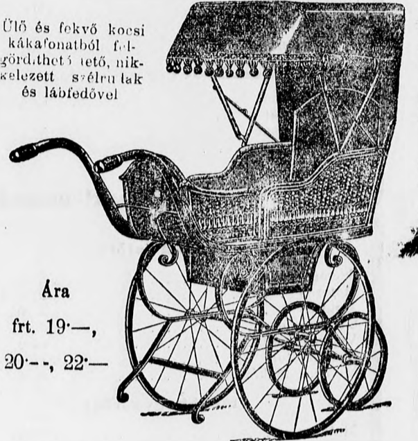
Ülő és fekvő kocsik kákafontból felgördíthető tető, nikkelezett szérlak és lábfedővel