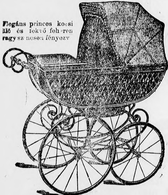
Elegáns princes kocsik ülő és fekvő fehérre vagy színesen fényezve