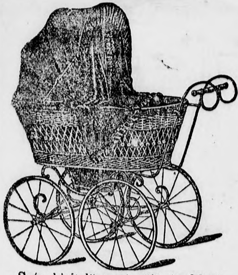
Szép kivitelű tartós ülő és fekvő kocsik. frt. 12-,-, 13-,-, 14-,-