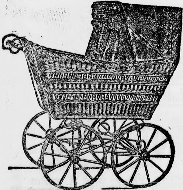
Erős, fonott kocsik frt 7, 8 és 9.