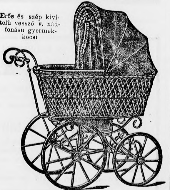
Erős és szép kivitelű vessző v. nád-fonású gyermek-kocsi