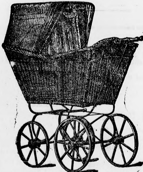
Egyszerű kivitelű kocsik frt 5, 6 és 7.