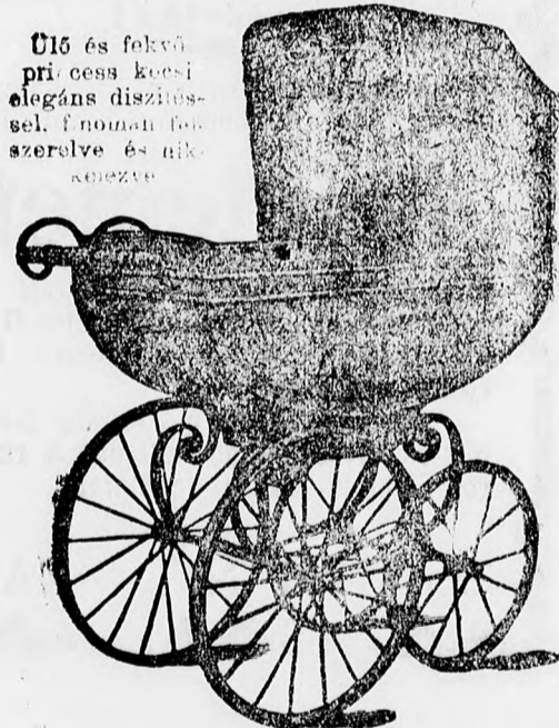
Ülő és fekvő princez kocsik elegáns díszítéssel, finomaként szerelve és nikkelezve