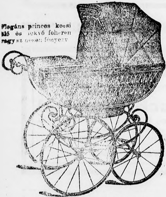
Elegáns princez kocsik ülő és fekvő fehérén vagy színesen festve