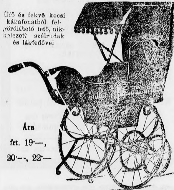
Ülő és fekvő kocsik kárfonatból felgördíthető tető, nikkelezett szélrudak és lábtetővel