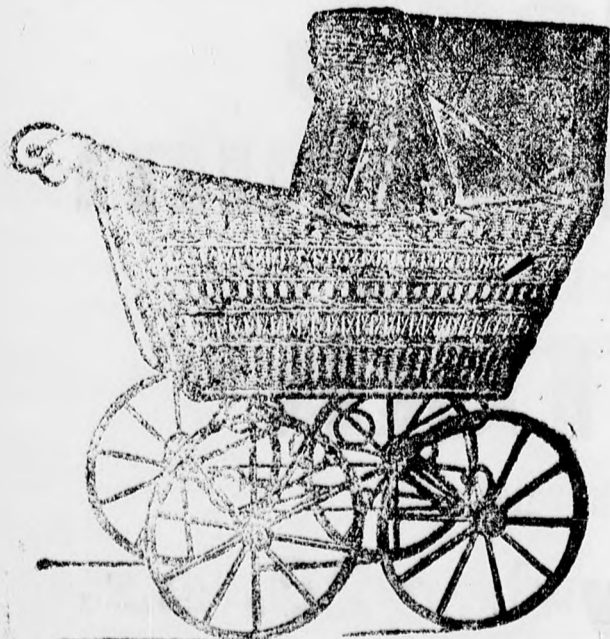
Erős, fonott kocsik frt 7, 8 és 9.