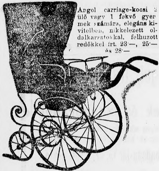
Angol carriage-kocsi 2 ülő vagy 1 fekvő gyermek számára, elegáns kivitelben, nikkelezett oldalkarzatokkal, felhuzott redőkkel frt. 23—, 25— és 28—