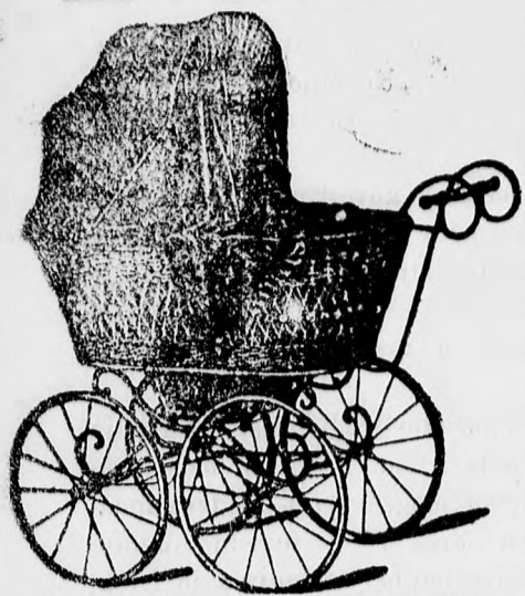
Szép kivitelű tartós ülő és fekvő kocsik. frt. 12—, 13—, 14—