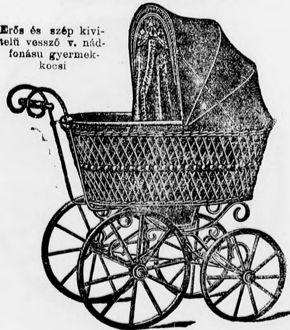
Erős és szép kivitelű vessző v. nád-fonású gyermek-kocsi