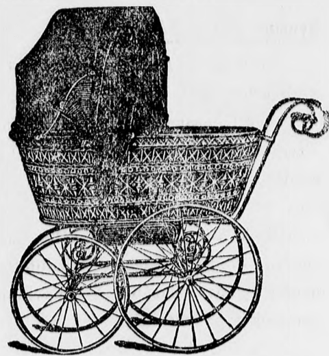
Finom ülő és fekvő kocsik fehérén, vagy színesen lakkozva, frt. 15—, 16—, 17—

Ujdonság! Cégemnek különlegessége. Átalakítható ülő és fekvő-kocsi legfinomabb kivitelben, frt. 35—tól 50—ig.