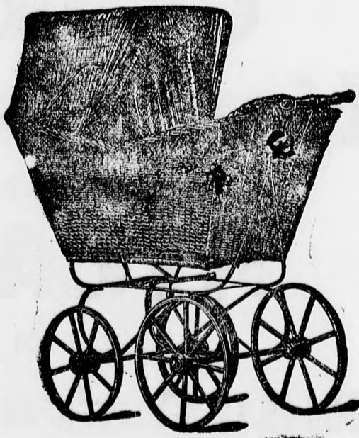
Egyszerű kivitelű kocsik frt 5, 6 és 7.