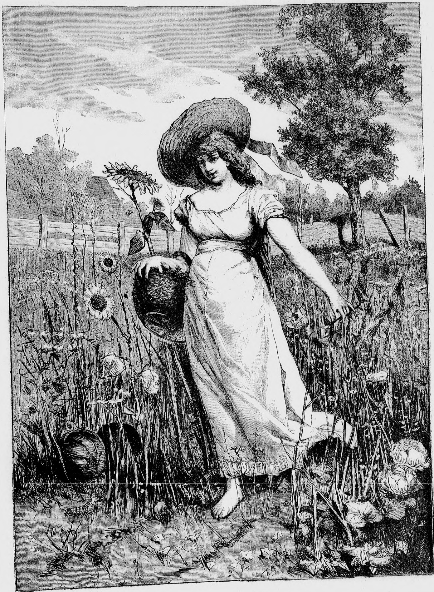
M á j u s.

Az egész sereg előre nyomult a németek golyózaporában és sikerült neki a magaslatot ismét visszafoglalni, de a katonák kétharmadrésze halva és haldokolva hevert a hóban.