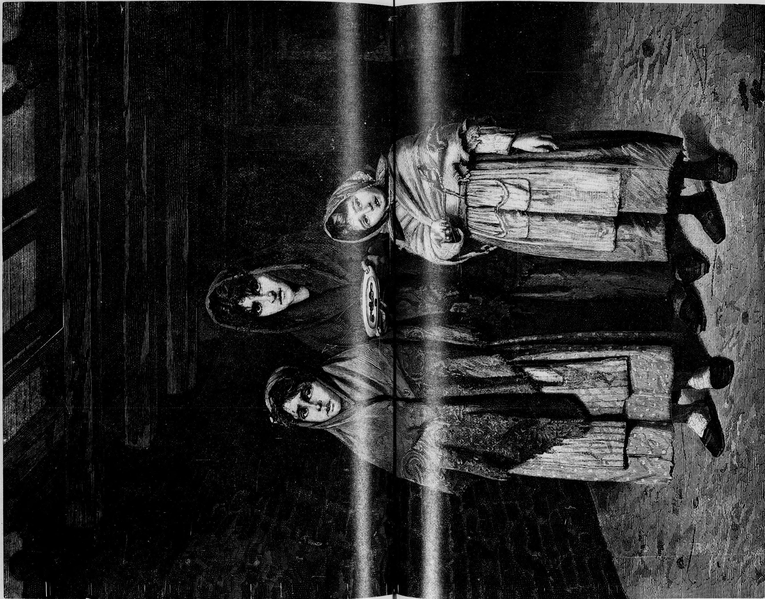
K. O. S. T. I. S. K.

A grófné szemeiben egy könnycsepp jelent meg. — Nem hagyod el soha? — gondoló magában. — Nem cselszövényre volna itt szükség, csak