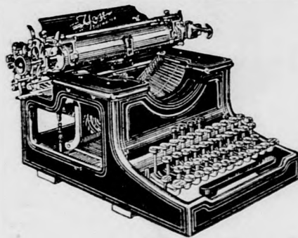
1912. évi modellje

A látható írásu nem szalagos 15. sz. YOST