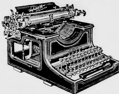
1912. évi modellje

A látható írásu nem szalagos 15. sz. YOST