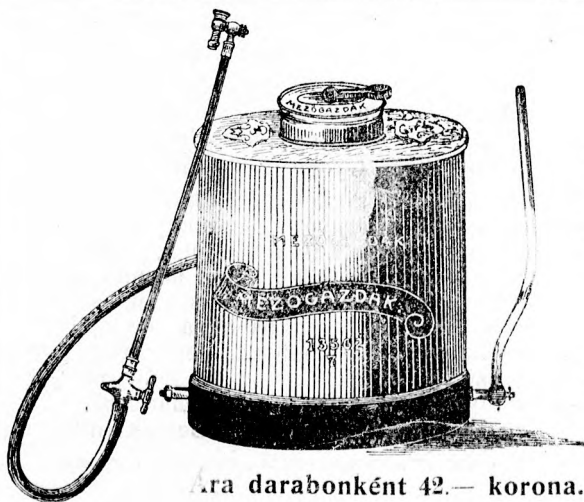
Ára darabonként 42.— korona.

Most jelent meg tavaszi és szőlőművelési árjegyzékünk amelyben az összes szőlővédekezési anyagok, eszközök és permetezők jutányos árai fel vannak tüntetve. Kívánatra ingyen és bérmentve megküldjük a gazdáknak. Magyar Mezőgazdák Szövetkezete Budapest, V., Alkotmány-utca 31.