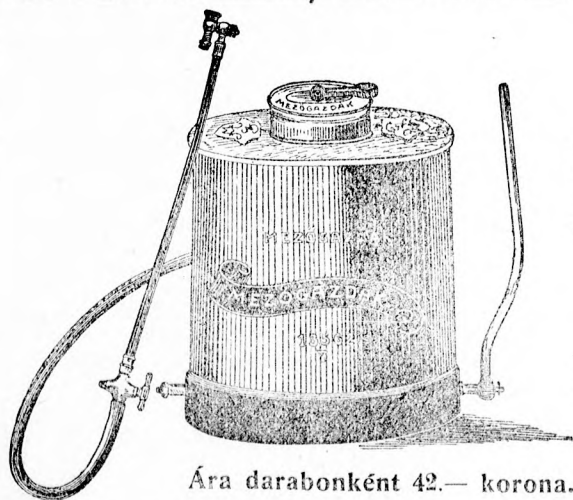
Ára darabonként 42.— korona.

CS. és KIR. UDV. MÜKERTÉSZ ÉS FAISKOLA-TULAJDONOS Budapest, VIII., Kálvária-tér 8. Árjegyzék ingyen és bérmentve.