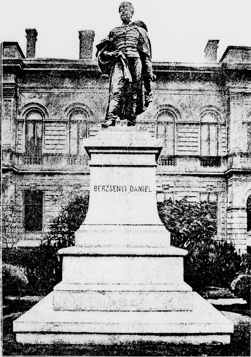
Berzsenyi Dániel szobra.

Az a kérdés is felmerül, vajjon a rovarok és általában az állatok, élvezetet találnak-e életükben és vajjon az életfentartás nehézségeit megtalálni és ellenségeiktől megmenekülni — életszikrájukat deprimálva érinti-e? A hangyák és méhek kemény munkája által szerzett téli szükséglet az ő tulajdonuk, míg azt a rablóktól megvédhetik, mert általában az állatoknál az ököljog még teljes virágzásban van, s hogy ezt eredményesen megvédhessék, néhány állatnál az a feltevés látszik uralkodni, hogy