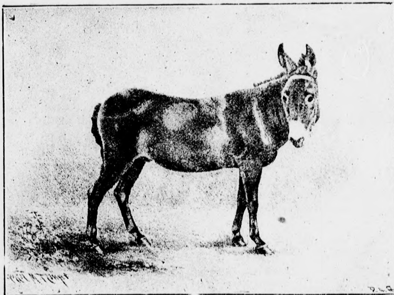
Az angol királynő kedvence.