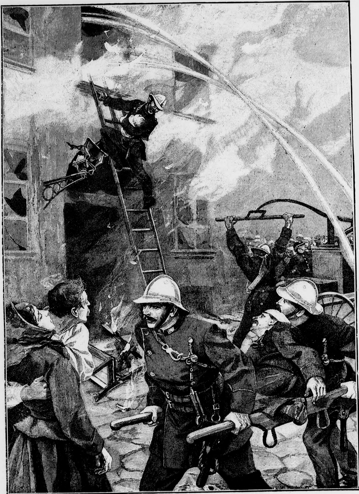
A mentés munkája.