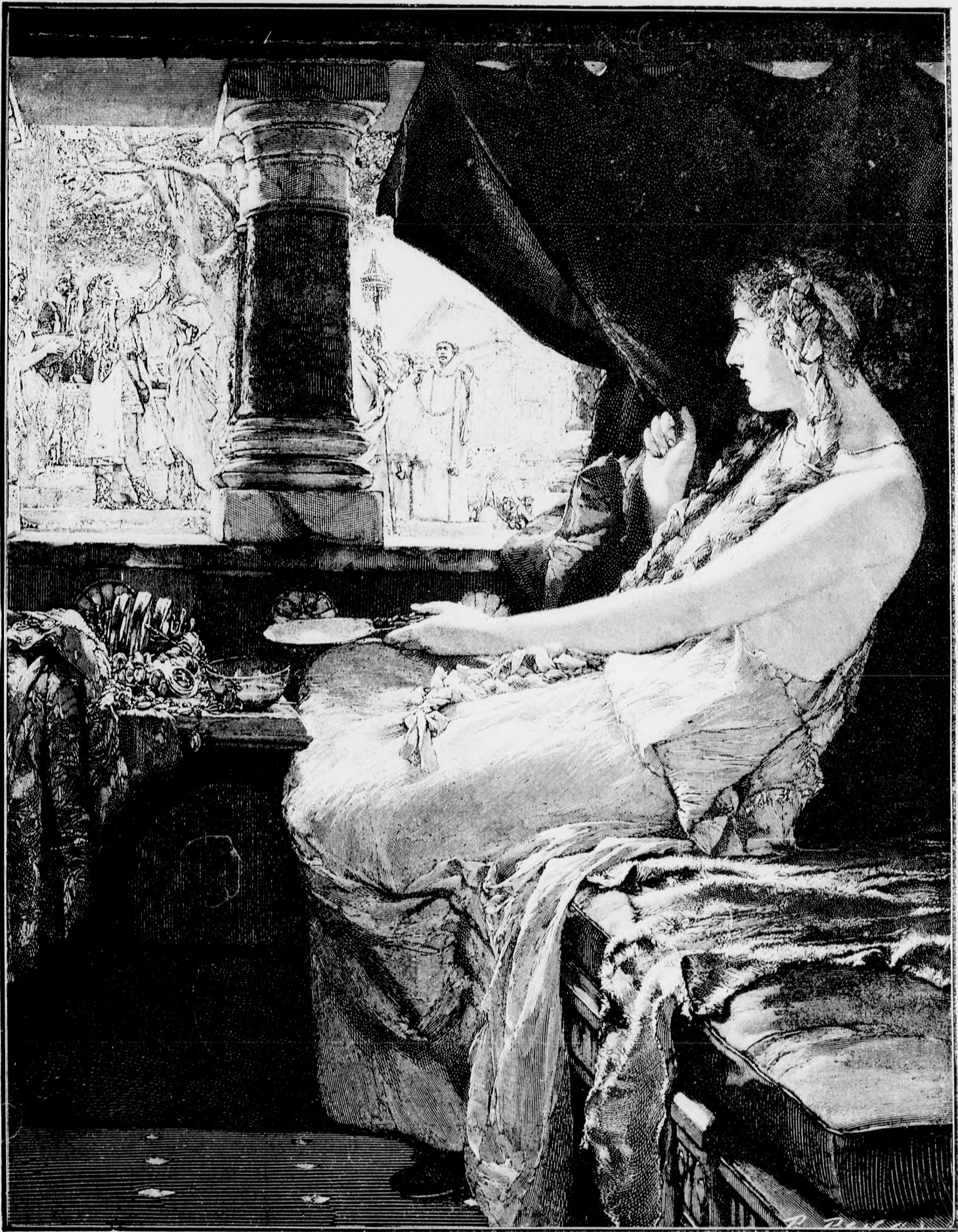
Pogányság és kereszténység.