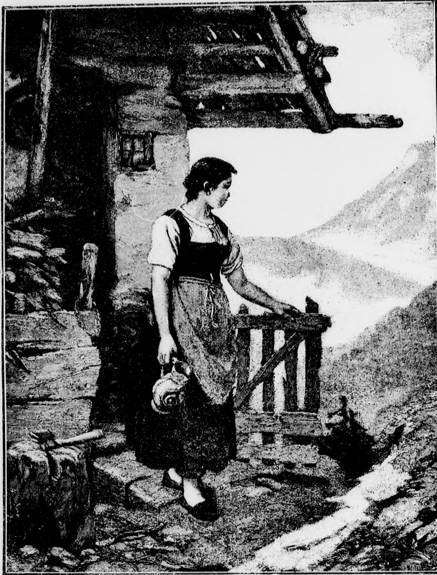
Vizért a kútra.

Mikor már a verést megelégte, kiszaladtak mind a hárman a szobából. Ott jajgatott a tisztelendő ur puha fehér ágyában és tünődött a történetek felett, a mit meg nem törtéنتé tenni nem lehetett.