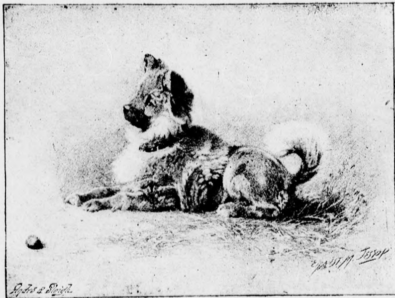
Az angol királynő kedvence.

E néhány alakkal ki is van merítve az egész