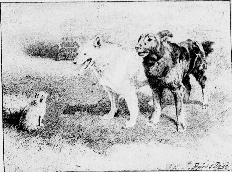
Az angol királynő kedvencei.

(Egymás derekát átkarolva, vidáman, boldog nevetéssel indulnak a szomszéd szobába. — A függöny legördül.)