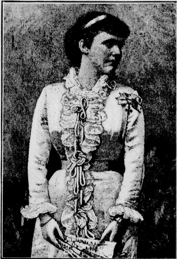
Erzsébet, Románia királynője (Carmen Sylva).

szabad pereze, ott volt zongorája, s ékesen szóló könyvei, melyek bőven kárpótolták a nagy társadalom hiu élveit.