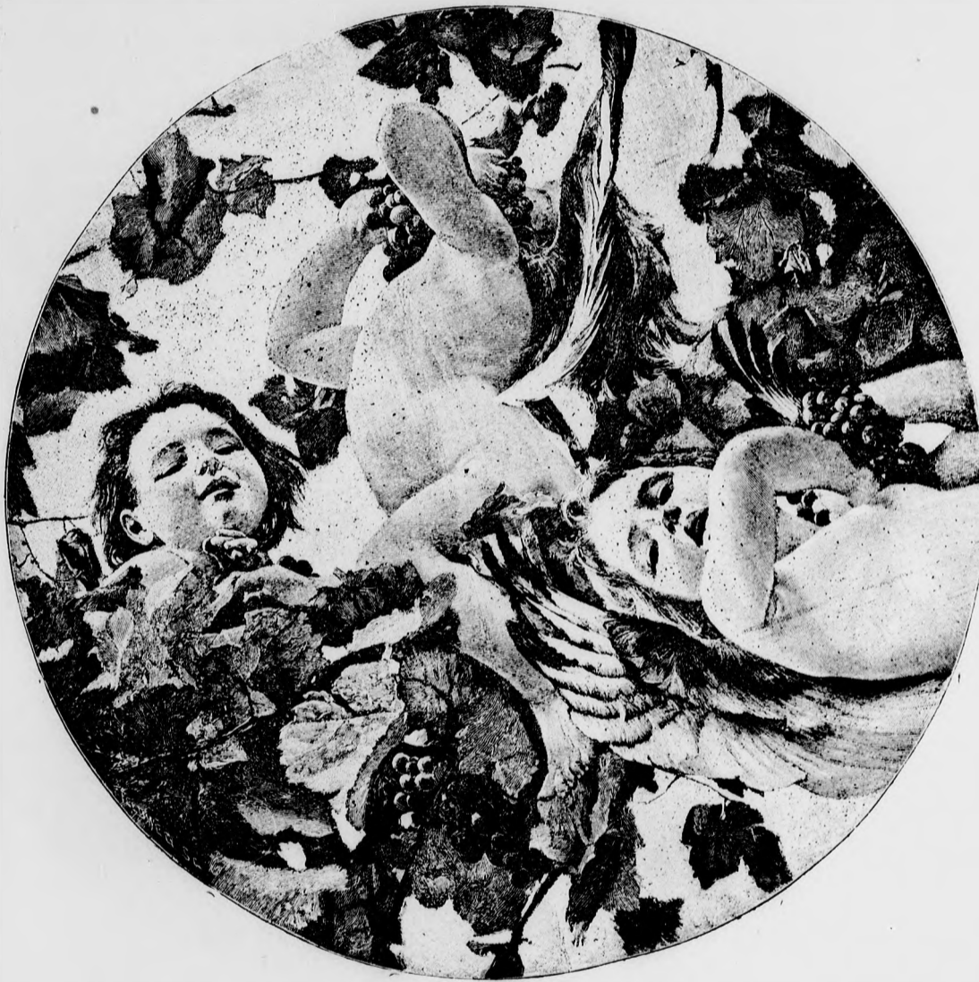
— ❖. Az ősz örömei. ❖ —