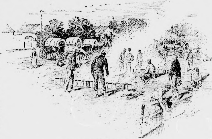
A tatai hadgyakorlatokból (menázsifőzés).

Vajás ur, meg az ő bájos felesége, Amália ő nagysága, a legnagyobb gyöngédséggel és szeretettel viselkedtek egymás iránt, mindannak daczára, házasetük felett elviharzott már vagy öt hosszú év. Pedig öt év igen meg tudja czibálni a szeretetnek lánczait, még ha aczél és nem rózsalánczok is azok. De az ő hűségük páratlan volt. A kis vörösnyaku orvos ki is fakadt már Vajás ur előtt, hogy hát mikép lehet ilyen unalmas életet élni. Az az egyformaság, az a szürke egyformaság! — Micsoda izlés, micsoda türelem! Lássá, énnekem is van feleségem, igaz, hogy egy kissé pupos, meg az egyik szemével félre is néz, de gazdag, sok pénze van és én mégsem ülök minduntalan mellette. — Egyszer itt, más-