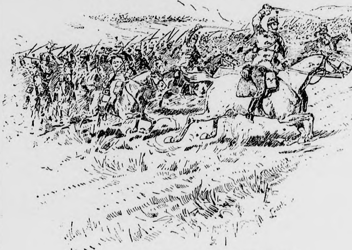
A tatai hadgyakorlatokból (huszárroham).

Egy pillanatig mintegy kétségbeesve veté magát egy kerevetre, azonban hirtelen felugrott, összeszorítá