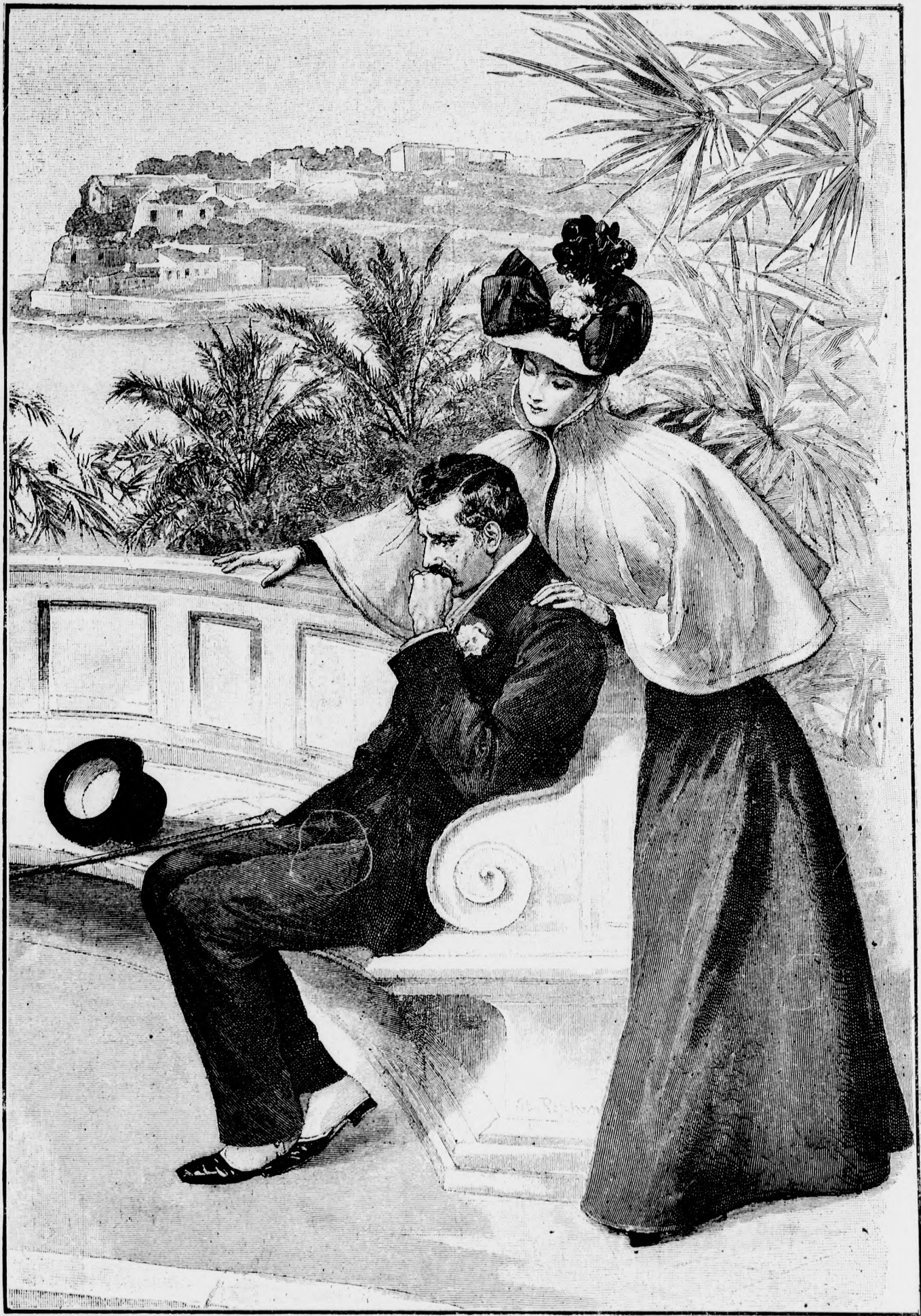
— Tönkrement! —