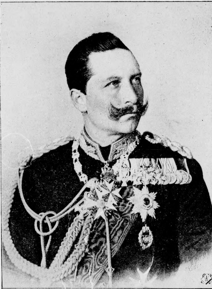
II. Vilmos német császár, porosz király.

A szép Szeremi Julesa előbb a szívéhez kapott, majd vadul felnevetett, azután bambán bámult maga elé — megtébolódott a szegény!