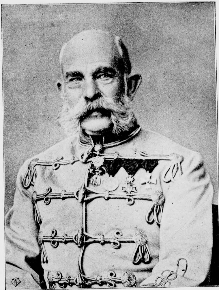
I. Ferencz József Magyarország apostoli királya.

— Ohó! Nem olyan szük az én házam. De tréfán kívül, engedje, hogy a lovat bekössem és megabakoltassam, avagy hazaviszem önökhöz kocsistól, ön meg bejön hozzánk egy csésze theára. Bizonyára el van fáradva, jó lesz kissé pihenni, Anna nagyon fog örülni, ha egy kicsit cseveghet önnel.