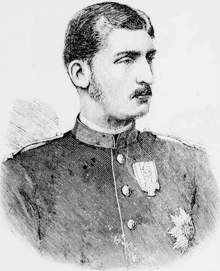
Ferdinánd, román trónörökös.

Dóra megemlítette nagymama előtt az érkezeteget, s egyuttal közlé a borzalmas változást is, mely gróf Szentváryn végbement. Az idős hölgy elgondolkodva biczentett fejével s végre mondá: