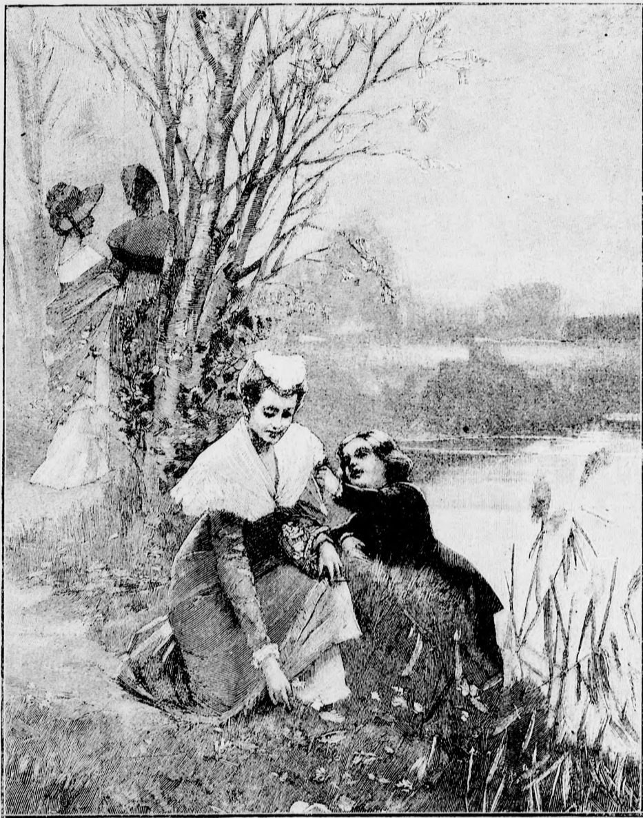
A tó partján.

— Legyen, — mondá szeliden, hiszen én valék ama levélke írója hogy hűségedet, Miczifenia, próbára tegyem. — Mert tudd meg, én is szerettelek téged, — szerettelek már akkor is, midőn Dragentina királykisasszony kezét megkértem, hogy az ő karjai között találjak balzsamot a te büszke bánásmódod által ütött sebekre. De szelid működésed házamban — itt Rokkobaldó hátlás tekintetet vetett a Miczifenia által kezelt legyezőre, mely a varázslótól oly szerencsésen elűzte az alkalmatlan „eszmelegyeket”, ismét megnyerte szívemet s egyszerűsmind újból bebizonyította azon örök igazságot, hogy szertelen hiuság a nőt, legyen az a leg-hatalmasabb varázslónő, leal-