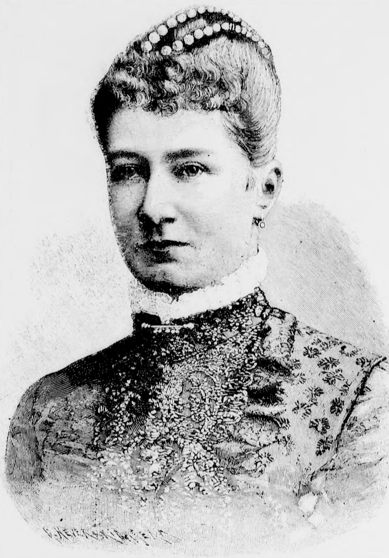
A német császárné.