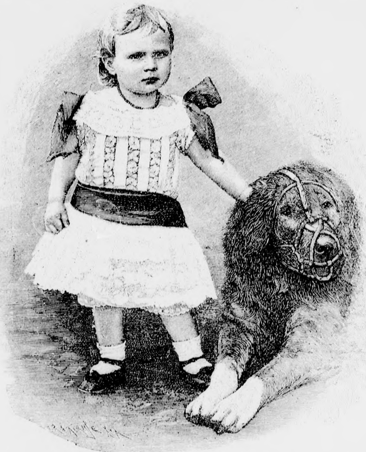
Ágost Vilmos, a német császár negyedik fia.

Micziferia még él, s így tudomása van róla, hogy ön szerencsétlen. Ha azonban ön elég bátorságot érez magában, akkor még minden jóra fordulhat! Kinzóm, a szörnyü Rökkobaldó, mint