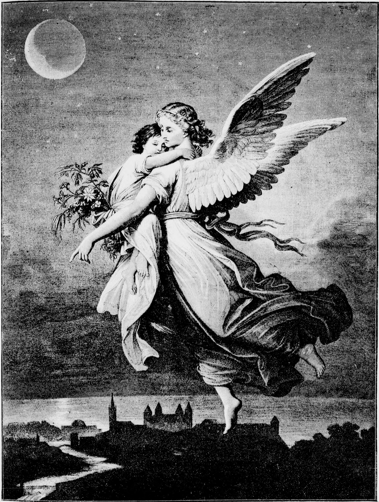
— † — Uton egy jobb hazába. — † —