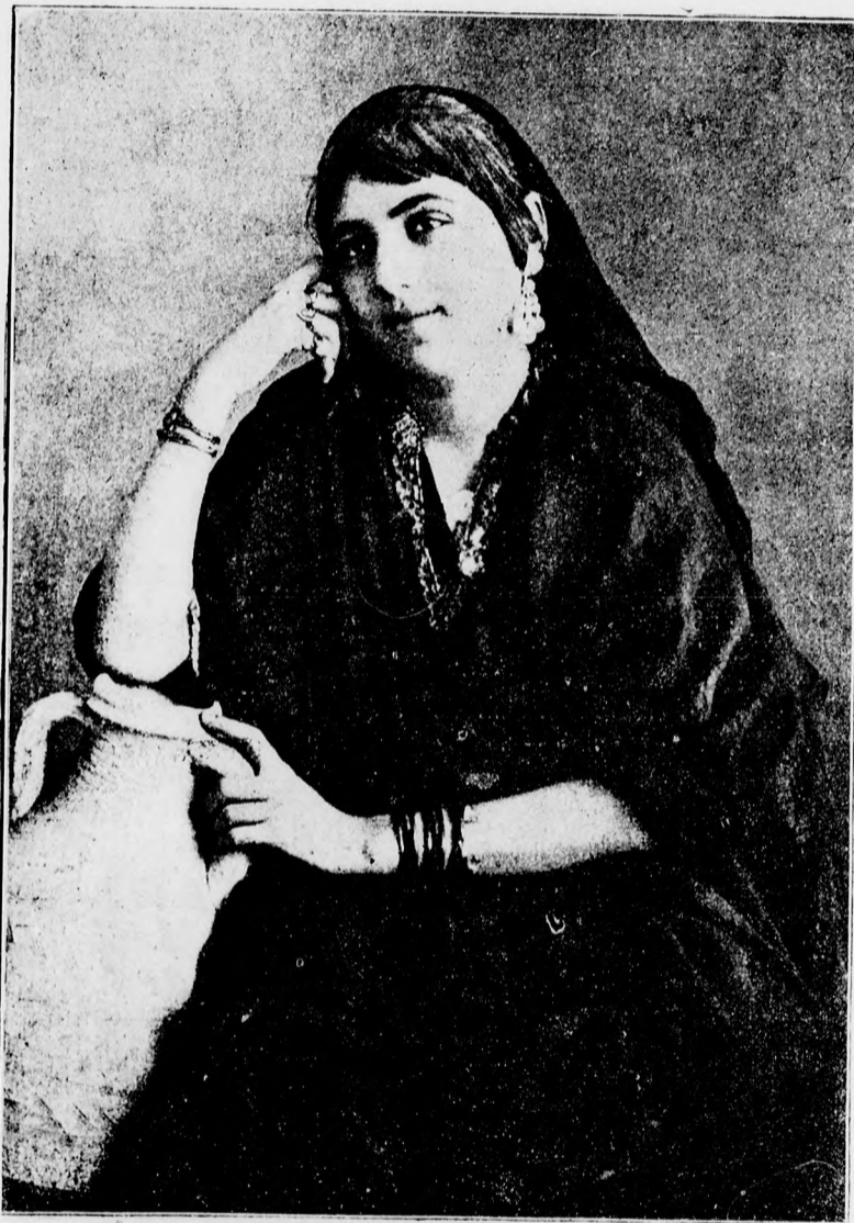
— Egyiptomi leány. —

Henry a legteljesebb szerelem kétségbeesésében könyektől árnyalt tekintetet vet rá s távozik Luciennel.