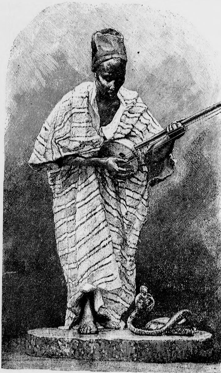
☞ Egyiptomi kigyóbűvölő. ☜

— Tövisbokr nem terem szőlőt. A megszelídített párducz hasonlít a macskához, egyebekben azonban egy ragadozó állatnak kölyke.