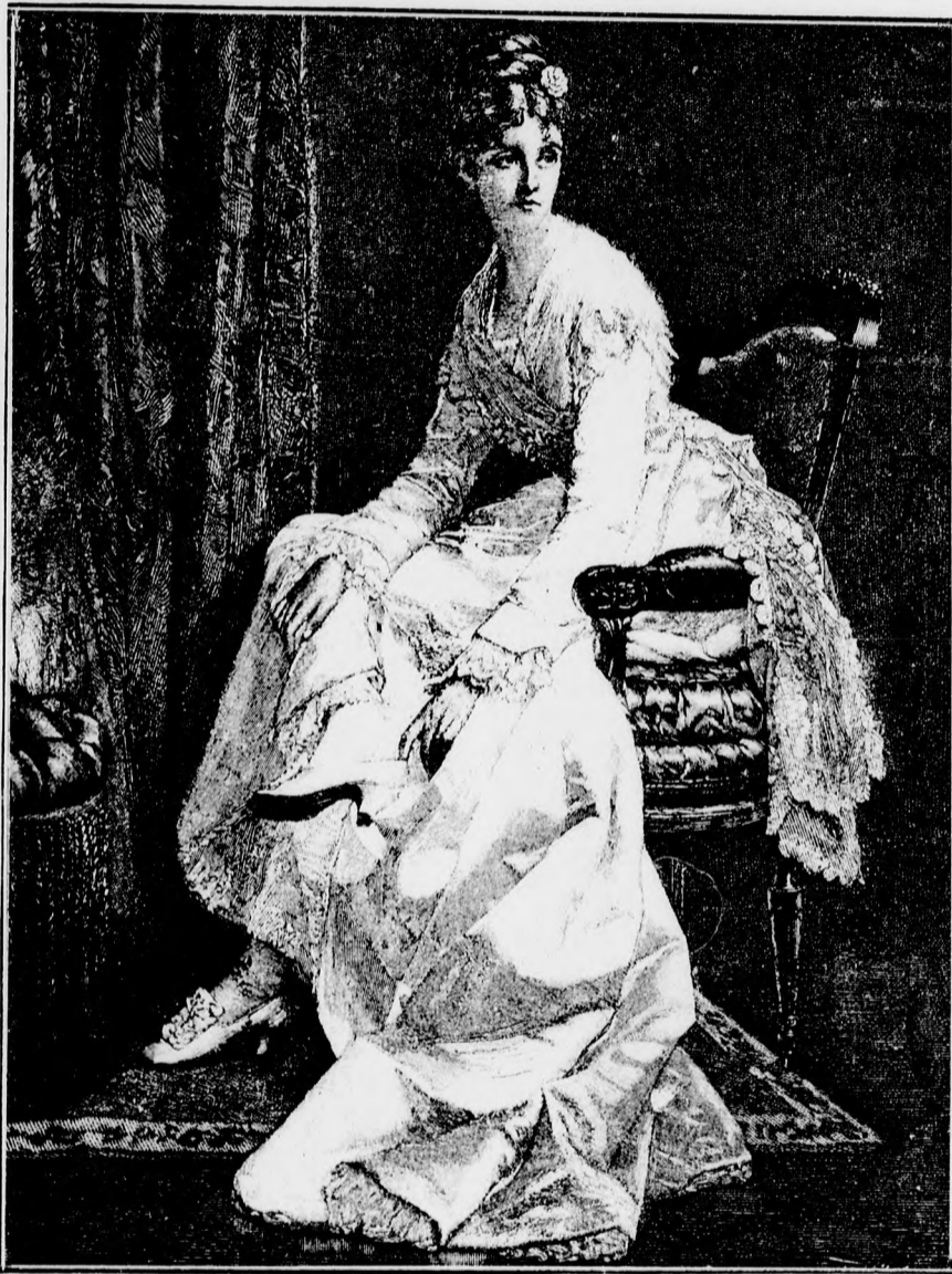
— A bál előtt. —

Az anyám nem szólt egy szót sem, csak keservesen elsírta magát és törülgette a vért, mely vastagon folyt róla, de a bátyámat, mintha kieserélték volna. Istenem! mikor előkapja az aranyozott botját, mikor elkezdé a feleségét ütni. „Hát te” mondja, „ilyen, amolyan, az én anyámat fogod bántani?” Bizonyossn megölte volna, ha nem lettek volna emberek. „Fuss”, mondják az