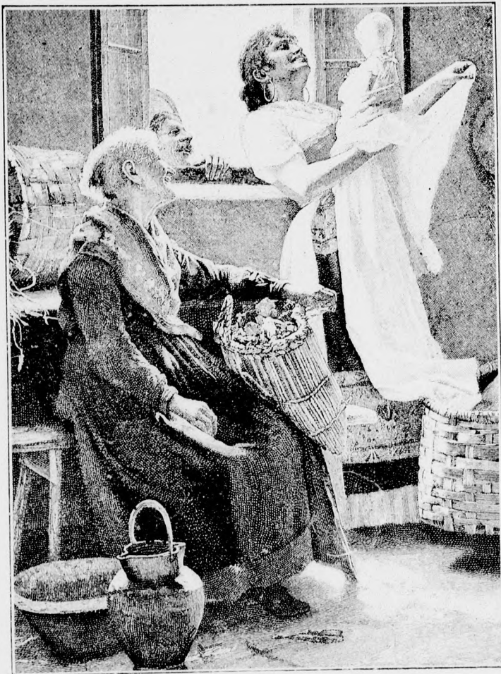
☞ Az elsőszülött. ☜

Honvágy? Miért? Hiszen rövid idő alatt ismét meglátja az otthonhagyott szeretteit; ez vigasztalja az utast; de mi vigasztalhatja a tengeri hajóst, a ki úgy válik el szeretteitől, hogy talán csak évek múlva láthatja azokat viszont, vagy talán soha, soha!