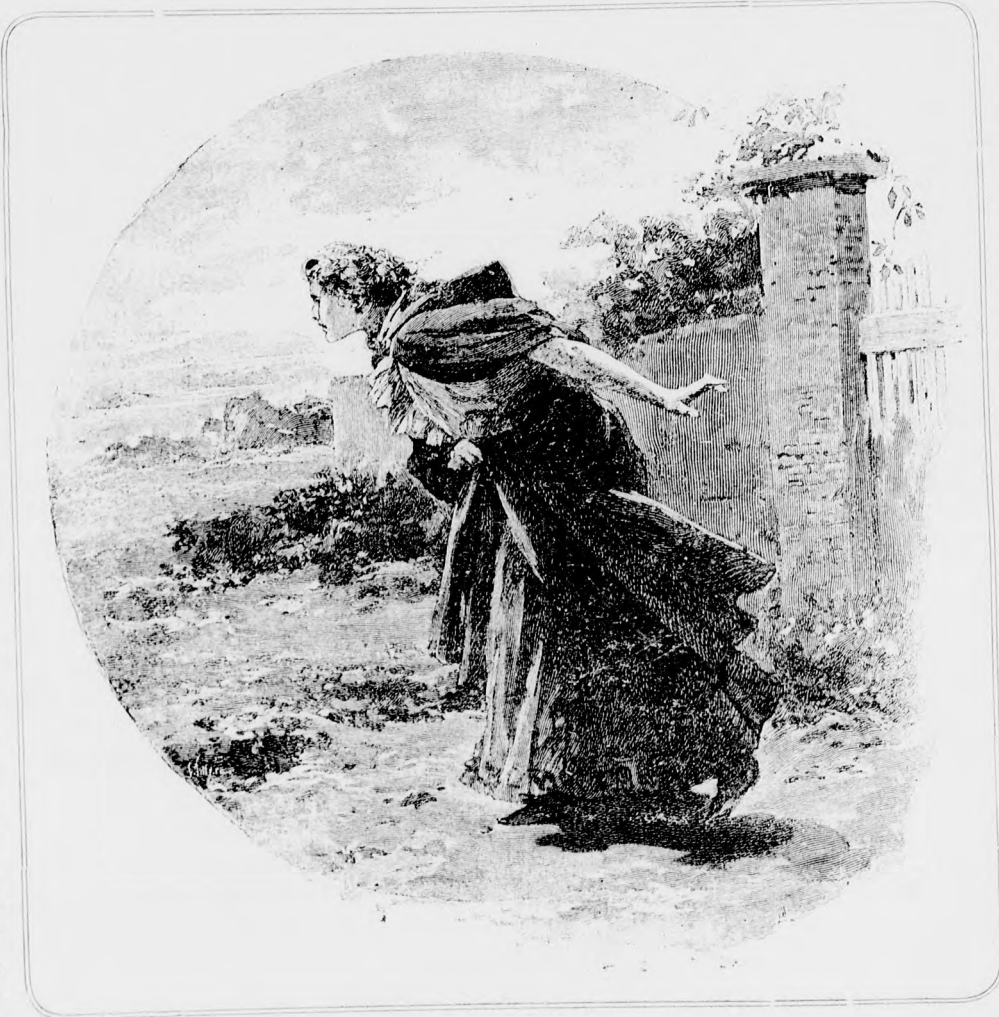
— Az örült. —

Miért is nem fogadta el az állást Szerra márkinőnél! Csak a gög nem engedte, hogy az ajánlatot elfogadja. Hiszen akkor talán helyes volt az a gög, de most megváltozott a helyzet. Most legfontosabb előtte az, hogy Andreával találkozzék, és tisztába jöjjön kételyeit illetőleg. Még az nap irni fog neki, hogy meggondolta magát és kész az említett állást elfogadni, ha még nincs betöltve. Hazament és azonnal irt s, fel is adta a postára a levelet; de Rikárdal és Agotával ellenben még nem beszélt