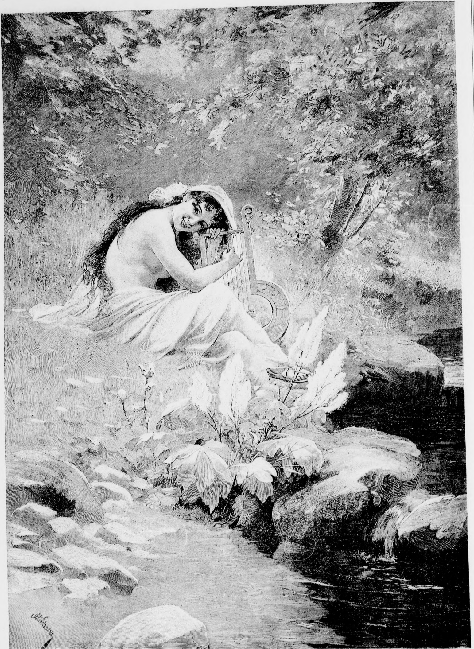
— † † † A VISSZHANG. † † † —