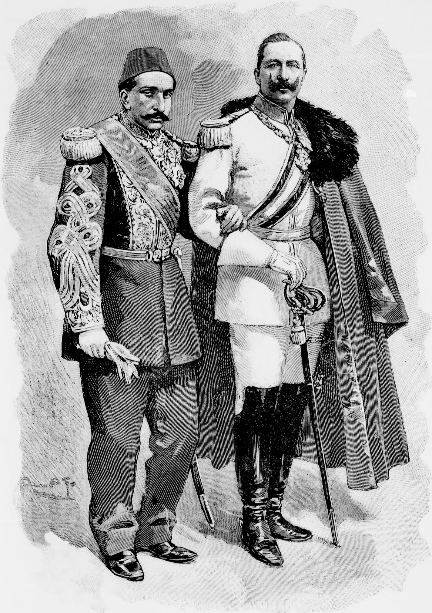
II. VILMOS NÉMET CSASZÁR ÉS ABDUL HAMID SZULTÁN.